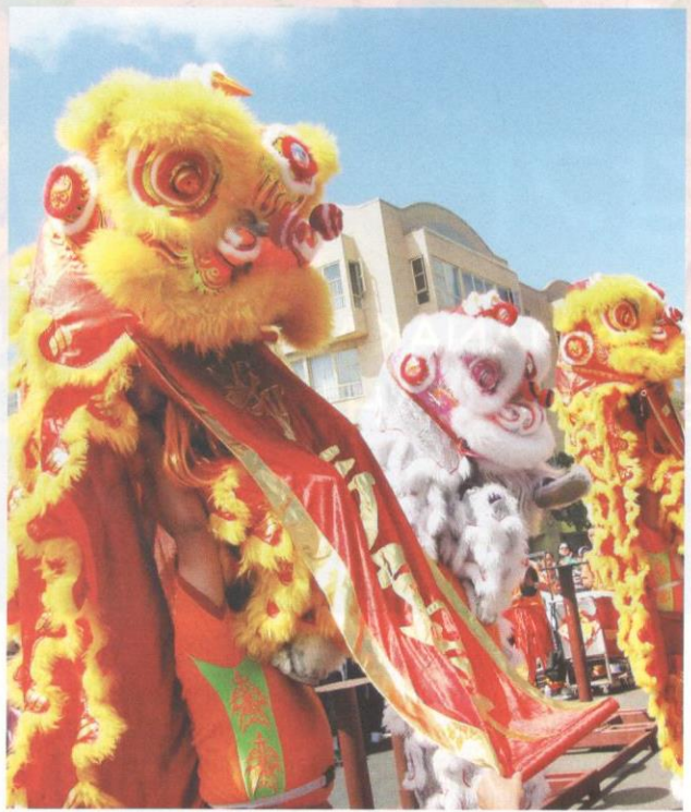
Tarian singa mempunyai keunikan yang tersendiri.