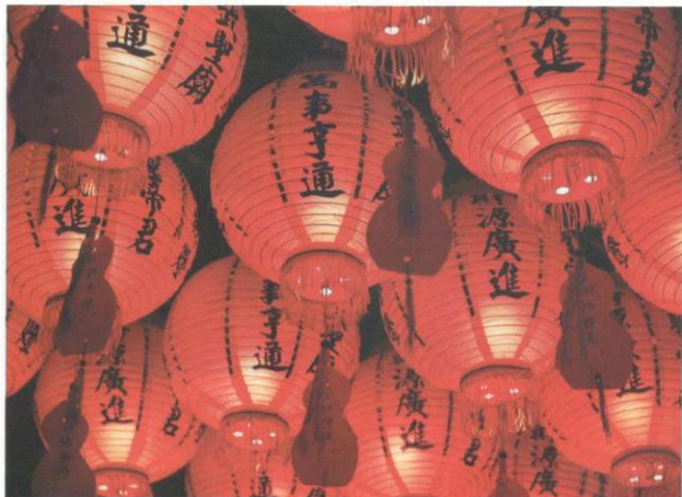
Tanglung digantung sempena perayaan Tahun Baru Cina.

Makanan secara sederhana dihidangkan. Sesetengah keluarga akan menghidangkan nasi berlaukkan sayur-sayuran untuk tujuan kesihatan badan selepas berjamu secara besar-besaran.