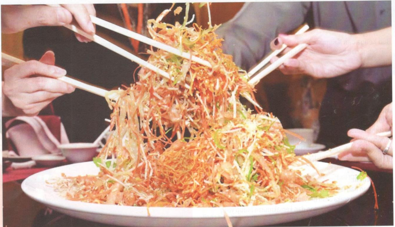
Yee Sang menjadi makanan tradisi sambutan Tahun Baru Cina.

Sambutan perayaan diteruskan dengan jamuan atau makan besar dan ucapan selamat bersama-sama ahli keluarga.