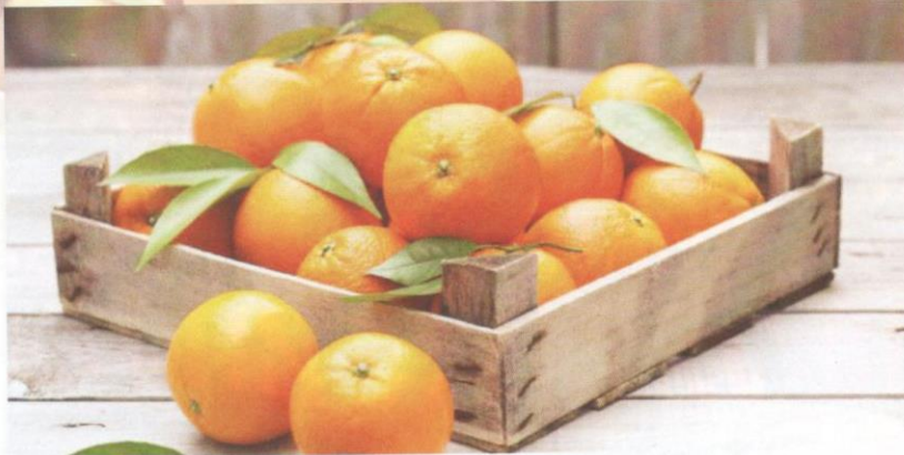
Buah limau melambangkan kekayaan bagi masyarakat Cina.