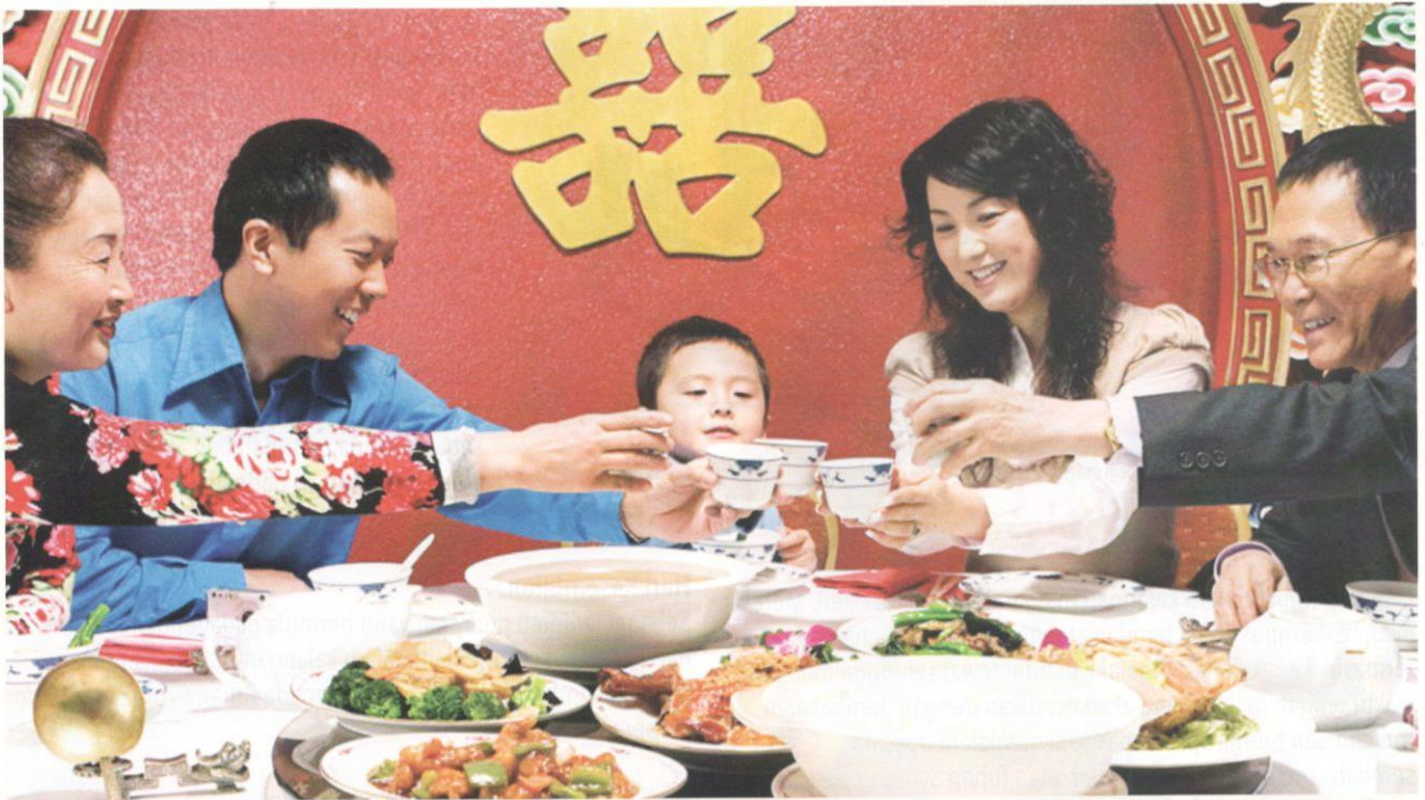
Upacara makan besar perayaan Tahun Baru Cina.

akan menyembah dewa sebelum menyampaikan hajat kepada mendiang leluhur. Pada kebiasaannya, anak perempuan yang sudah berumah tangga akan menziarahi keluarga pada hari tersebut.