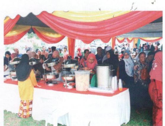
"Berolek" atau kenduri di Negeri Sembilan.

Antara tanggungjawab Ibu Soko termasuklah melaksanakan ketentuan agama dan adat. Setiap wanita dalam Adat Perpatih merupakan ibu contoh dalam