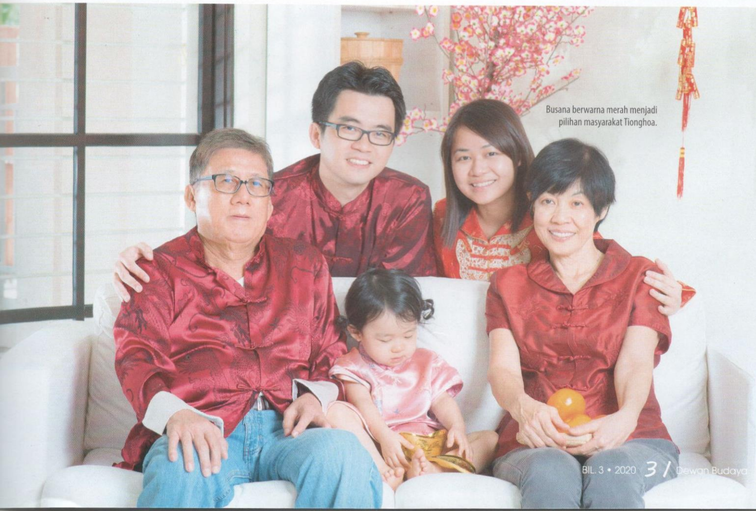
Busana berwarna merah menjadi pilihan masyarakat Tionghoa.