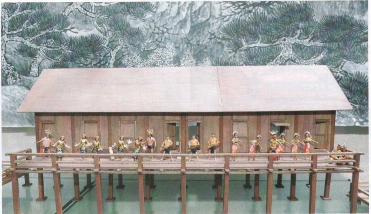
Koleksi diorama yang memaparkan kebudayaan etnik di Sarawak.

dihasilkan mempunyai identiti dan keunikan tersendiri yang melambangkan asal usul rumah tersebut. Antara ciri-ciri binaan yang membezakan setiap rumah tradisional di Malaysia termasuklah binaan bumbung, bilangan tiang dan binaan tingkap. Oleh hal yang demikian, masyarakat dapat mengecam dengan mudah asal usul rumah tradisional tersebut apabila