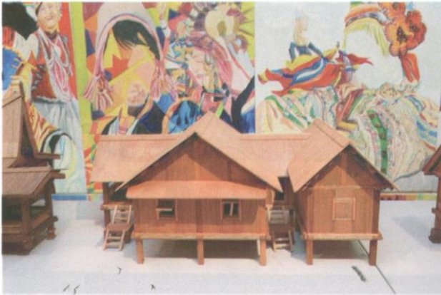
Koleksi rumah tradisional yang terdapat di setiap negeri dan dibuat menggunakan kaedah tanggam.