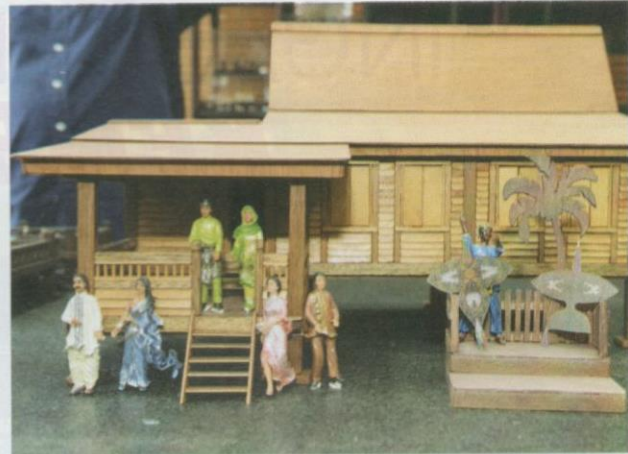
Kebudayaan masyarakat Malaysia dapat dilihat pada koleksi diorama milik Foo Loke Kee.

alatan muzik. Koleksi patung doh tersebut dipadankan dengan rumah tradisional etnik tersebut. Patung doh diorama ini dihasilkan dengan menggunakan campuran tanah liat. Setelah patung doh tersebut siap dibentuk, artis seni akan melukis dan mewarnakan patung tersebut dengan busana tradisi, tarian kebudayaan dan alat muzik supaya pengunjung dapat melihat dengan lebih dekat.