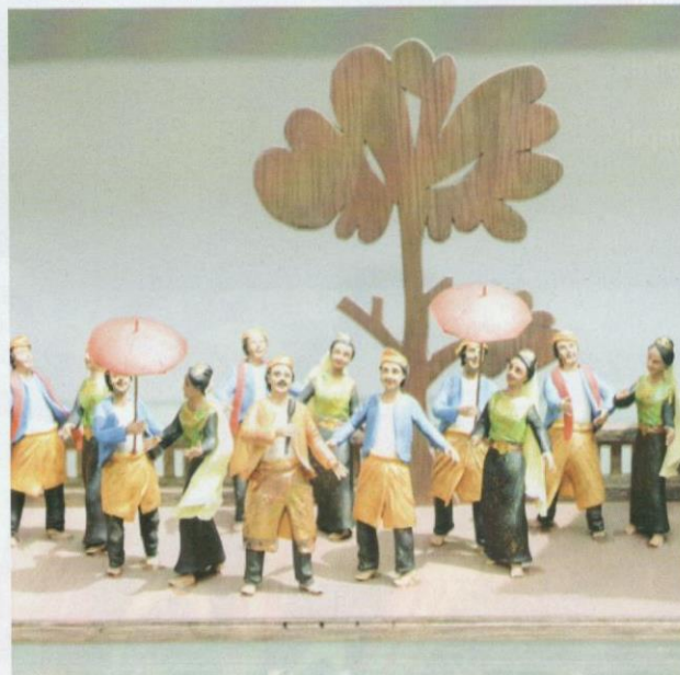
Koleksi patung doh yang memaparkan pakaian dan tarian tradisional masyarakat Melayu.

Foo Loke Kee juga menonjolkan kebudayaan setiap etnik di Malaysia, terutamanya yang terdapat di Sabah dan Sarawak. Beliau menghasilkan koleksi patung doh diorama yang menggambarkan pakaian tradisi etnik, tarian kebudayaan dan