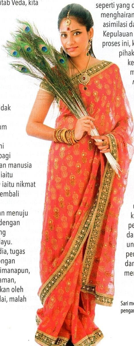
Sari menjadi pakaian utama bagi pengantin wanita Hindu.

Peringkat seterusnya ialah meminang. Proses ini juga hampir sama seperti yang diamalkan dalam komuniti Melayu. Hal ini tidaklah menghairankan kerana sejarah membuktikan bahawa terdapat asimilasi dan pengaruh budaya India terhadap penduduk di Kepulauan Melayu sejak abad kedua sebelum Masihi. Dalam proses ini, keluarga pihak lelaki akan berkunjung ke rumah pihak wanita untuk meminang secara rasmi. Sebelum itu, kebiasaannya pihak lelaki sudah menyemak raasi untuk melihat keserasian antara pasangan. Urusan semakan raasi dibuat oleh pakar agama dengan mengambil kira tarikh, masa dan tempat kelahiran pasangan terbabit bagi menentukan porutham , iaitu jodoh.