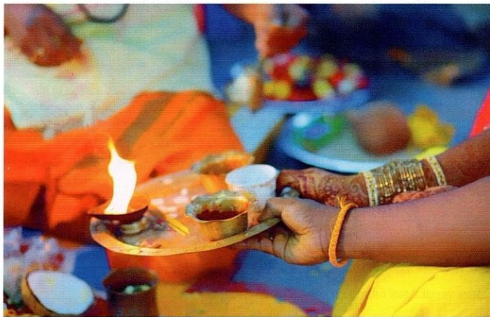
Perkahwinan Hindu mempunyai amalan tradisi yang unik.

Secara umumnya, perjalanan menuju ke alam perkahwinan bermula dengan proses merisik, sama seperti yang diamalkan oleh masyarakat Melayu. Mengikut tradisi masyarakat India, tugas merisik diserahkan kepada golongan yang lebih dewasa. Walau bagaimanapun, selari dengan perkembangan zaman, tugas merisik juga dapat dilakukan oleh saudara mara dan sahabat handai, malah bakal pengantin itu sendiri.