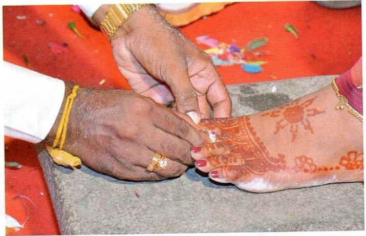
Suami menyarungkan gelang kaki yang dikenali sebagai metti pada jari kaki isteri.

Maka itu, selesailah upacara perkahwinan mengikut adat India yang beragama Hindu. Seterusnya, malam