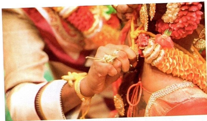
Upacara mengikat taali dalam perkahwinan Hindu.

Upacara perkahwinan di kuil atau dewan orang ramai dirujuk sebagai kalyanam , atau istilah yang lebih tepat ialah muhurtam . Pemilihan dan penetapan tarikh serta masa upacara perkahwinan dilakukan dengan merujuk kepada pakar agama, iaitu sami di kuil. Sami akan merujuk kalendar khas yang dipanggil panjagam untuk mencadangkan muhurta naal , iaitu tarikh perkahwinan dan muhurta neeram , iaitu masa perkahwinan. Tarikh dan masa ini boleh disemak pada kalendar Hindu yang semakin popular dalam kalangan masyarakat Hindu di Malaysia.