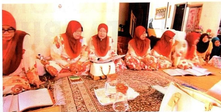
Kumpulan marhaban wanita.

Pada era 2000 hingga sekarang, kumpulan marhaban pada sambutan Hari Raya Aidilfitri sudah tiada lagi, kecuali di kampung-kampung tradisi.