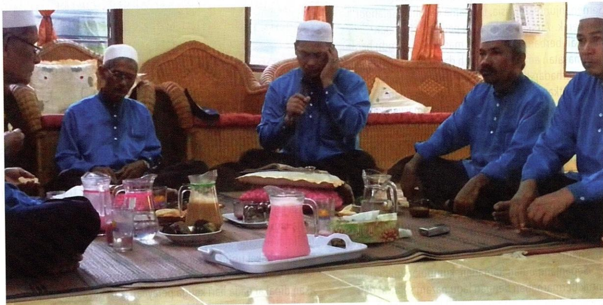
Amalan berzanji dalam marhaban.

Kumpulan dibentuk atas inisiatif ahli kumpulan marhaban tahun-tahun sebelumnya. Mereka menyampaikan rancangan untuk menubuhkan kumpulan marhaban dari mulut ke mulut untuk berkumpul pada hari raya pertama selepas solat sunat Aidilfitri. Keahlian kumpulan tidak terhad bilangannya dan pakaian baju Melayu bebas warnanya. Mereka