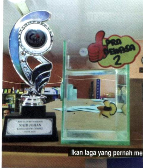
Ikan laga yang pernah menjadi johan pertandingan kecantikan.