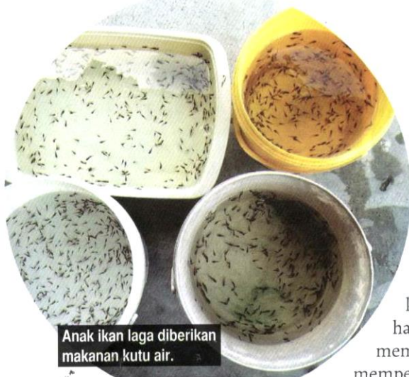
Anak ikan laga diberikan makanan kutu air.