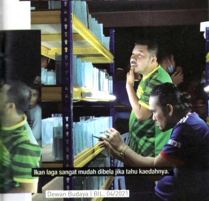
Ikan laga sangat mudah dibela jika tahu kaedahanya.

Disebabkan oleh minat yang mendalam terhadap ikan laga, pernah terjadi seorang lelaki melepaskan kerjayanya sebagai pensyarah tetap di sebuah universiti.