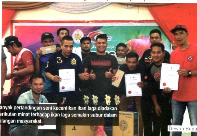
Banyak pertandingan seni kecantikan ikan laga diadakan berikutan minat terhadap ikan laga semakin subur dalam kalangan masyarakat.

Di kedai ikan hiasan, ikan laga dijual serendah RM3. Keunikan dan ciri istimewa ikan ini sebenarnya menjadikan penentu harga, sehingga mampu mencapai harga RM6000 seekor. Oleh sebab itu, kebiasaan penternak ikan laga bermula daripada hobi. Lama-kelamaan mendapat permintaan ramai dan mula menyedari potensi besar terhadap industri ikan laga. Dengan dunia tanpa sempadan hari ini, mereka mempromosikan ikan ini melalui media sosial. Rata-rata peminat ikan laga juga membuat tempahan melalui telefon atau e-mel daripada pembekal.