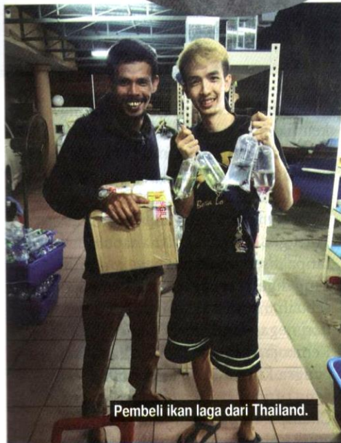
Pembeli ikan laga dari Thailand.