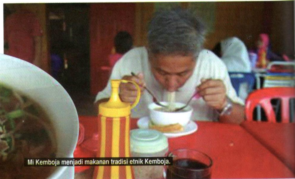
Mi Kemboja menjadi makanan tradisi etnik Kemboja.