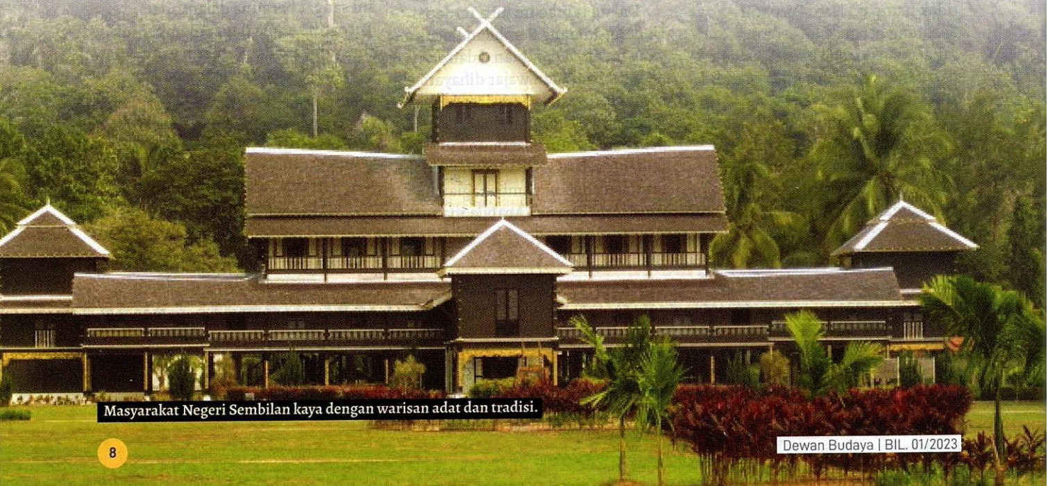
Masyarakat Negeri Sembilan kaya dengan warisan adat dan tradisi.

Undang-undang Minangkabau turut menyatakan amalan hukum berasaskan dua sumber utama, iaitu hukum adat dan hukum syarak. Hukum syarak bersumberkan al-Quran dan hadis, manakala hukum adat adalah warisan daripada Dato Ketemenggungan dan Dato Perpatih Sebatang. Sekiranya disusun semula sejarah awal undang-undang adat ini dari Mercu Gunung Merapi, dapat diandaikan undang-undang tersebut sudah bermula sejak sebelum kedatangan Islam. Ciri-ciri keaslian undang-undang ini begitu ketara melalui pepatah-petitih adat yang diungkapkan, tersusun dalam