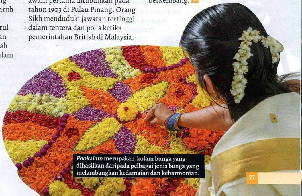
Pookalam merupakan kolam bunga yang dihasilkan daripada pelbagai jenis bunga yang melambangkan kedamaian dan keharmonian.

Dengan setiap etnik membawa ciri-ciri unik yang tersendiri, masyarakat India di Malaysia turut berperanan penting dalam membentuk identiti kebudayaan negara ini. Keistimewaan ini memberikan warna dalam kehidupan masyarakat Malaysia, serta mengukuhkan perpaduan dalam suasana terangkum yang sentiasa berkembang. DB