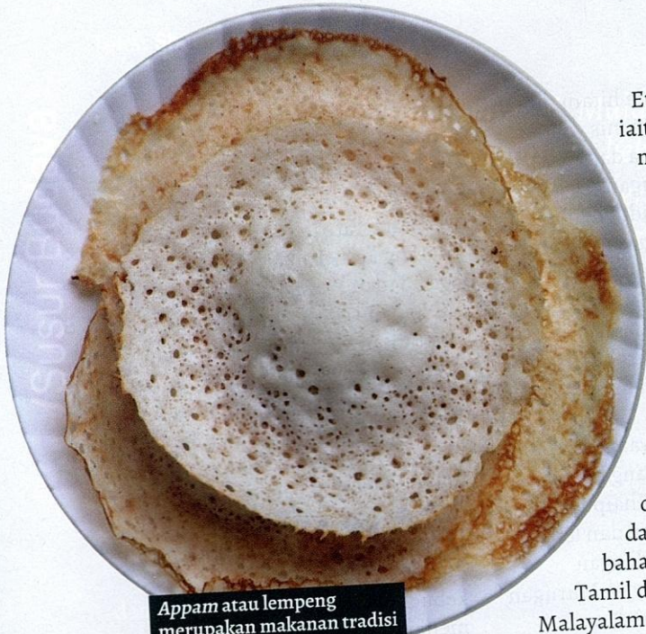
Appam atau lempeng merupakan makanan tradisi bagi masyarakat Malayali.

terutamanya oleh warga Telugu Malaysia. Tahun Baharu Telugu ini juga terkenal dengan masakan yang dikenali sebagai Ugadi Pachadi . Makanan ini diperbuat daripada pes asam jawa (masam), bunga neem (pahit), gula perang atau jaggery (manis), garam meja (garam), cili hijau (pedas) dan mangga mentah (astringen). Makanan ini merupakan peringatan secara simbolik bahawa fasa kehidupan yang kompleks harus dijangkakan secara munasabah pada tahun baharu.