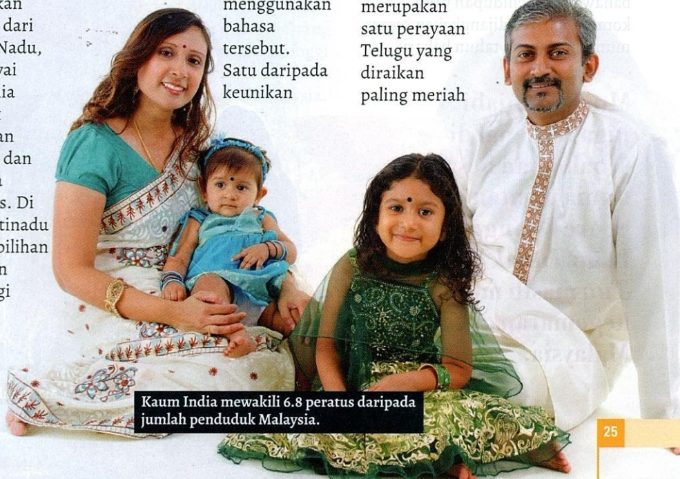
Kaum India mewakili 6.8 peratus daripada jumlah penduduk Malaysia.

Ugadi pula merupakan satu perayaan Telugu yang diraikan paling meriah