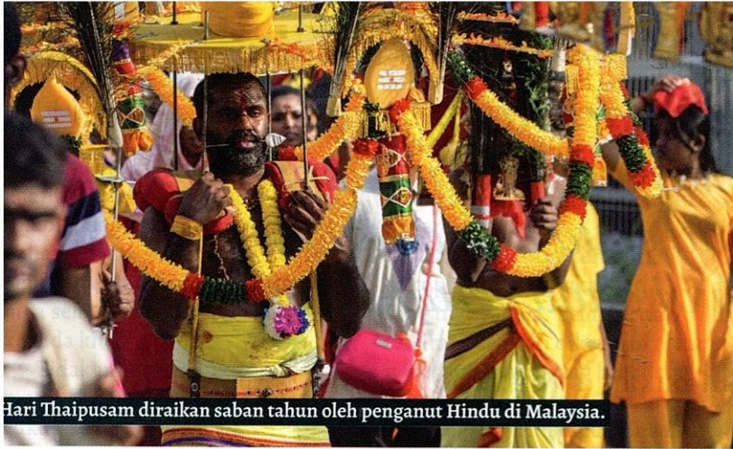
Hari Thaipusam diraikan saban tahun oleh penganut Hindu di Malaysia.

diperbuat daripada tepung beras dan ditapai menggunakan ragi.