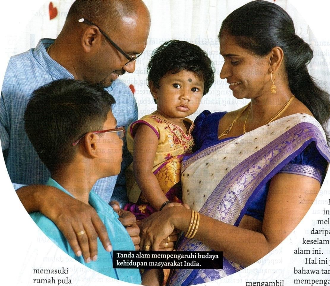
Tanda alam mempengaruhi budaya kehidupan masyarakat India.

memasuki rumah pula dikaitkan dengan kesusahan yang bakal ditimpa keluarga. Dari segi logiknya, bisa ular boleh membunuh seseorang dan biawak boleh menggigit serta mencederakan orang. Tanda alam ini juga menjadi panduan kepada anggota masyarakat agar pintu rumah tidak dibiarkan terbuka tanpa perhatian bagi mengelakkan kemasukan haiwan liar, selain mengelakkan sebarang kecurian.