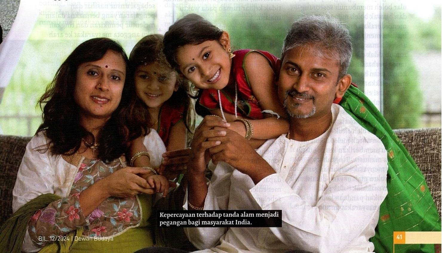
Kepercayaan terhadap tanda alam menjadi pegangan bagi masyarakat India.

Kemasukan kelawar ke dalam rumah yang dikaitkan dengan aspek kematian pula menekankan risiko penyakit yang bakal dihasilkan kelawar melalui gigitan atau air liurnya. Ular dan biawak yang