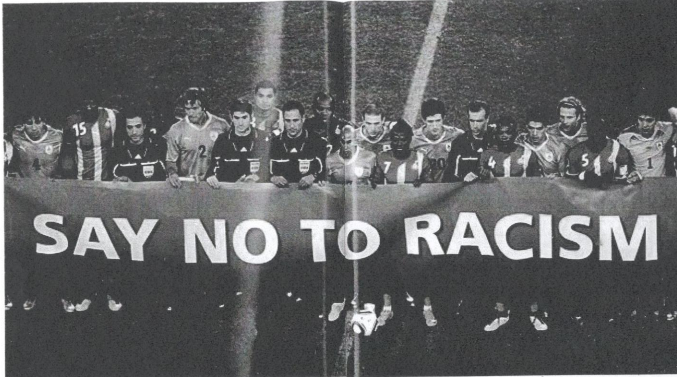
Sukan bola sepak menjadi landasan terbaik untuk menghentikan isu perkauman.

Namun, bukan itu fokus yang ingin diperjelaskan, tetapi yang lebih penting dan utama adalah bagaimana sukan menyatukan rakyat yang datang