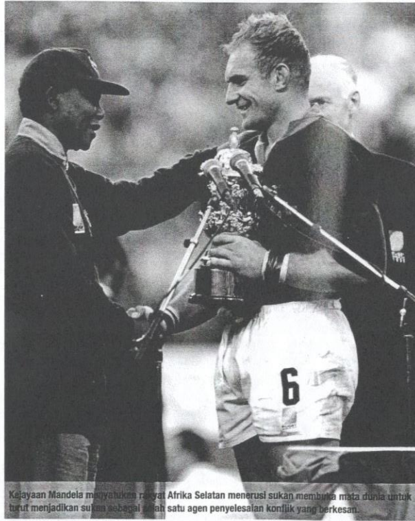
Kejayaan Mandela menyatukan rakyat Afrika Selatan menerusi sukan membuka mata dunia untuk turut menjadikan sukan sebagai salah satu agen penyelesaian konflik yang berkesan.

Kesempatan sebagai penganjur sukan utama dunia memberikan ilham kepada Nelson untuk menjadikan sukan sebagai satu platform mengembalikan keamanan kepada rakyat di Afrika tanpa membeza-beza warna kulit. Pada perlawanan akhir yang belangsung di Stadium Ellis Park, Johannesburg, lebih daripada