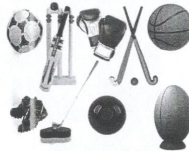
Antara alatan yang di perlukan dalam melakukan aktiviti sukan.

Melalui dasar ini juga, sukan dibahagikan kepada dua bahagian, iaitu sukan untuk semua dan sukan untuk kecemerlangan, yang dilakukan secara serentak agar pengetahuan pelajar tentang sukan serta minat mereka terhadap bidang ini dapat ditingkatkan.