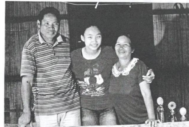
Di samping ibu dan bapa yang menjadi tulang belakangnya adalah ini.

KEJAYAAN YANG DITEMPA OLEH GADIS BERKULIT CERAH BERUSIA 17 TAHUN INI CUKUP MEMBANGGAKAN SELURUH RAKYAT MALAYSIA. BERHASIL DALAM MISI MURNI MENGHARUMKAN NAMA NEGARA DI TEMASYA SUKAN PARA ASEAN DI SINGAPURA TAHUN LALU, ANAK KELAIHRAN KOTA KINABALU INI BERJAYA MENGGONDOL TIGA PINGAT EMAS DALAM ACARA 100 METER, 200 METER DAN 400 METER BAGI KATEGORI WANITA T3 (CACAT PENGLIHATAN).