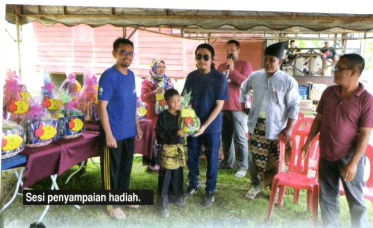
Sesi penyampaian hadiah.

Secara keseluruhannya, penganjuran sukan bendang ini merupakan satu kejayaan besar yang menjadi kebanggaan bersama. Kesepakatan dan kerjasama yang tinggi dalam kalangan penduduk seharusnya dipuji lantaran mereka mengamalkan peribahasa Melayu, berat sama dipikul ringan sama dijinjing. Berkat daripada usaha tersebut, penganjuran pesta ini ternyata mendapat sambutan yang memberangsangkan. Usaha murni untuk memartabatkan kembali sukan bendang memerlukan sokongan semua pihak. Banyak sukan tradisi yang perlu digiatkan kembali kerana penganjuran aktiviti sukan tradisi pada hakikatnya tidak memerlukan kos yang tinggi. Maka itu, wajarlah sukan bendang terus dijadikan acara tahunan kerana acara ini ternyata mampu mengembalikan senyuman, gelak ketawa dan mengimbas kembali langsir ingatan tentang dunia kanak-kanak yang pernah dilalui pada suatu ketika dahulu. DB