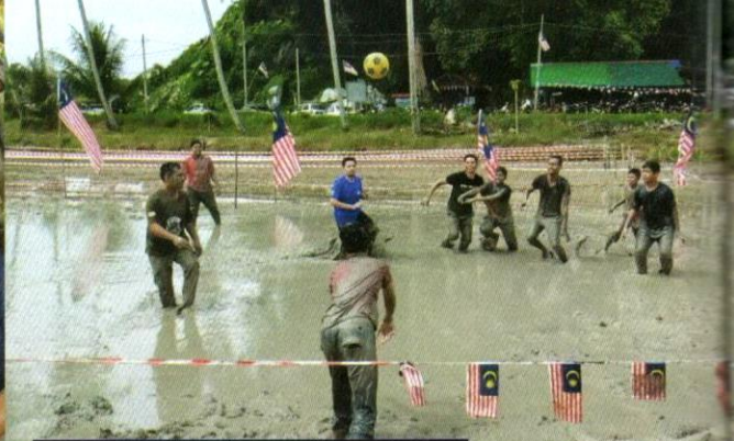
Para peserta bergelumang dengan lumpur demi mengejar kejuaraan.