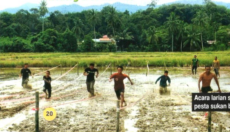
Acara larian sebagai pembuka tirai pesta sukan bendang.

Yang istimewanya, selepas tamat semua acara, para peserta bersama-sama membersihkan diri di tali air yang berdekatan. Kesegaran jelas kelihatan apabila mereka bersama-sama membersihkan diri dan berendam di dalam tali air. Segala selut dan lumpur yang menyaluti tubuh mereka hilang bersama.