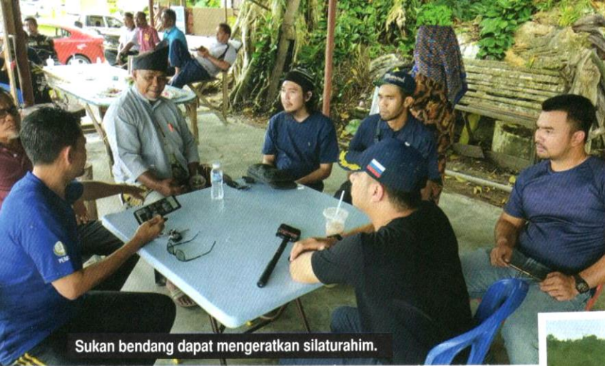
Sukan bendang dapat mengeratkan silaturahmi.

gus menolak pandangan generasi baharu bahawa bendang merupakan kawasan untuk menanam padi semata-mata. Penganjuran pesta seperti ini secara tidak langsung dapat mengeratkan hubungan sesama peserta dan pengunjung. Mereka dapat bertanyakan khabar dan mengenali antara satu sama dengan yang lain. Hal ini pastinya dapat memberikan nilai tambah kepada usaha mempergiatkan industri pelancongan berasaskan warisan kebudayaan.