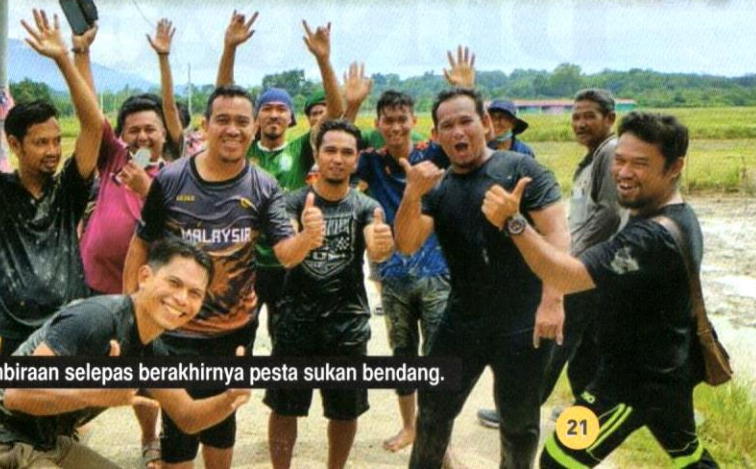
Para peserta meraikan kegembiraan selepas berakhirnya pesta sukan bendang.

Meskipun diselaput lumpur, para peserta tetap gembira.