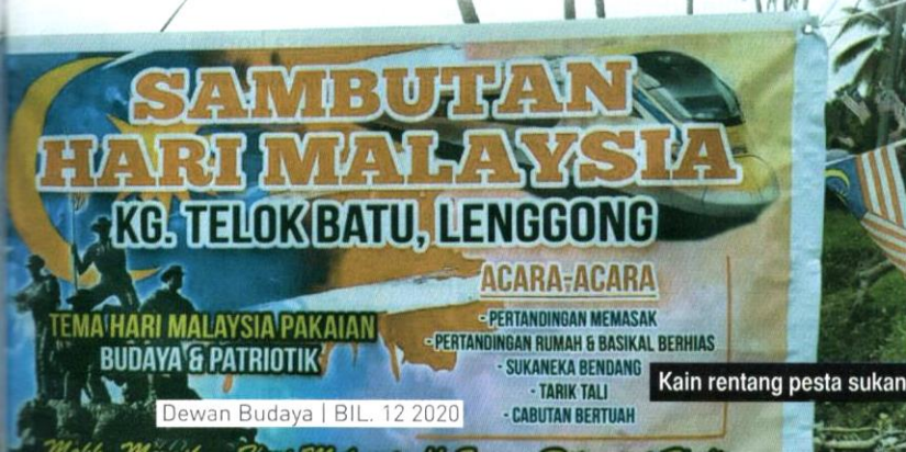
Kain rentang pesta sukan bendang.

Pada hari kejadian, lebih 500 pengunjung tanpa mengira usia hadir dari kampung berdekatan di sekitar Lenggong, bahkan ada yang hadir dari Gerik dan Kuala Kangsar. Para pengunjung mula membanjiri jalan dan tali air di tepi sawah bagaikan semut menghurung gula. Sepanjang pesta ini berlangsung, pengunjung dapat melihat dan merasai pengalaman bermain sukan bendang, sekali