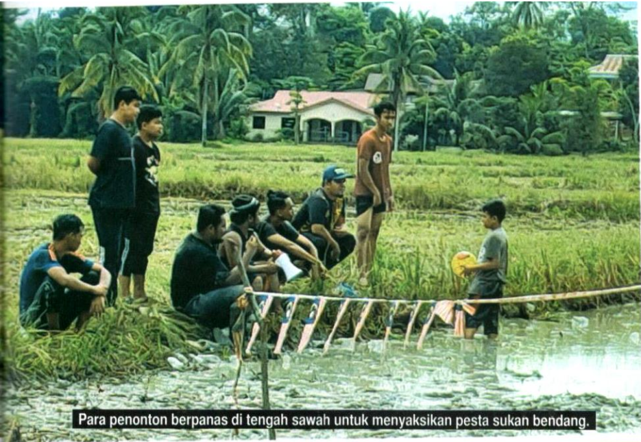
Para penonton berpanas di tengah sawah untuk menyaksikan pesta sukan bendang.