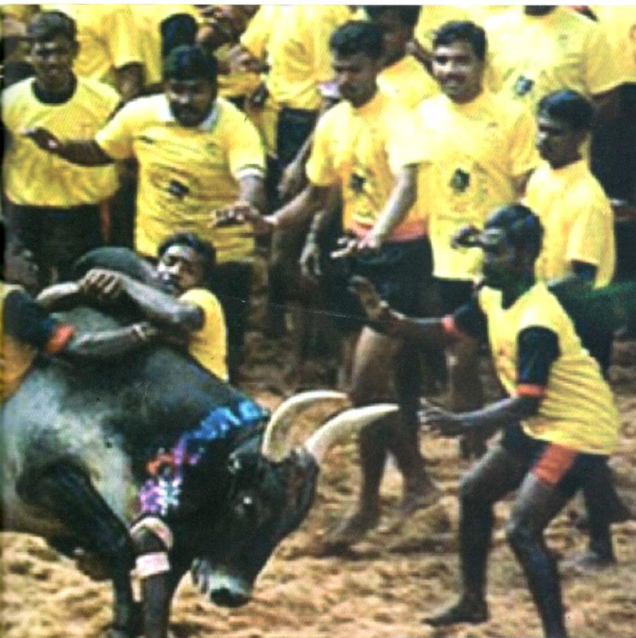
Sekumpulan peserta bertarung "menjinakkan" lembu jantan.

Permainan ini dinamakan sedemikian kerana melibatkan seekor lembu jantan yang dilepaskan melalui pintu sempit, yang dikenali sebagai vaadivaasal , ke dalam arena dan peserta lelaki akan cuba meraih kantung yang terikat pada tanduk lembu dengan merangkul bonggol lembu tersebut. Untuk mengawal lembu tersebut, peserta cuba mencapai ekor and tanduknya. Tujuannya adalah untuk memastikan kantung berjaya diraih tanpa dcederakan oleh lembu.