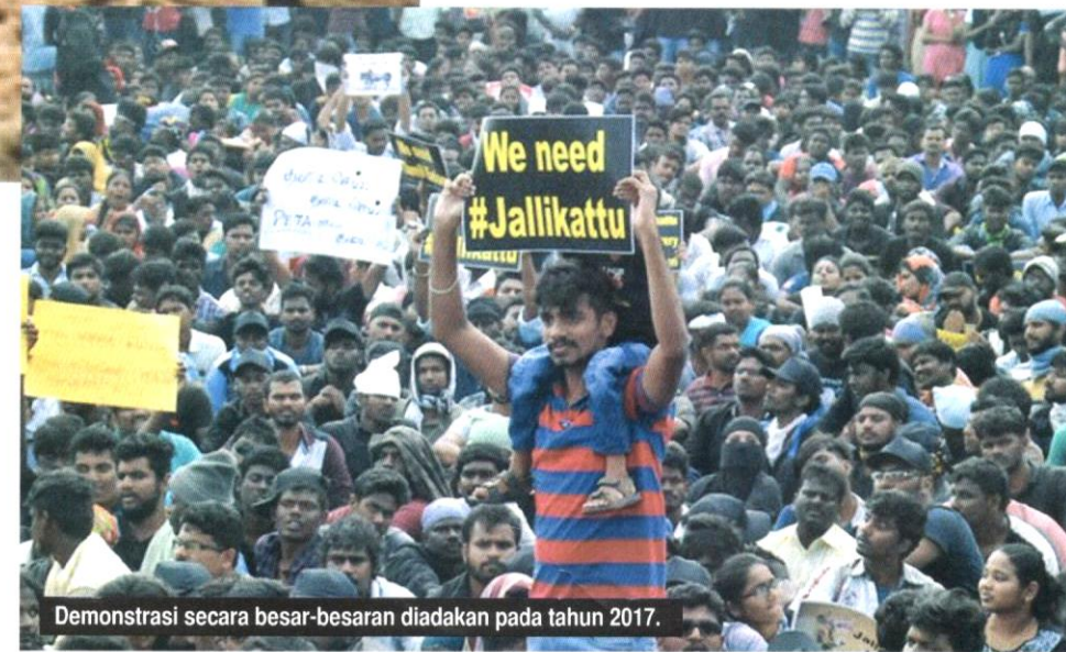
Demonstrasi secara besar-besaran diadakan pada tahun 2017.

Jallikattu sangat terkenal dan meriah di Tamil Nadu, terutamanya di Alanganallur (Madurai), Trichy, Pudukkottai dan Sivaganga. Jallikattu merupakan