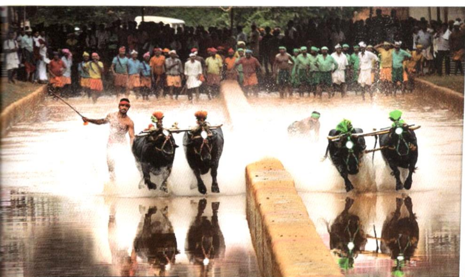
Sukan Kambala di Karnataka.

kerana dipaksa berada dalam situasi yang menakutkan dan tertekan. Selain itu, Jallikattu juga menimbulkan ancaman dan risiko besar terhadap para peserta dan juga penonton kerana reaksi lembu yang tidak dapat diramal. Pada masa yang sama, ternyata memang wujud kes kematian dan kecederaan dalam kalangan peserta akibat permainan ini. Lembu juga ditemui terluka, bahkan mati apabila peserta berusaha untuk menundukkan lembu itu. Perkara ini dilihat sebagai tindakan zalim dan tidak mempunyai belas kasihan terhadap kehidupan di muka bumi ini.