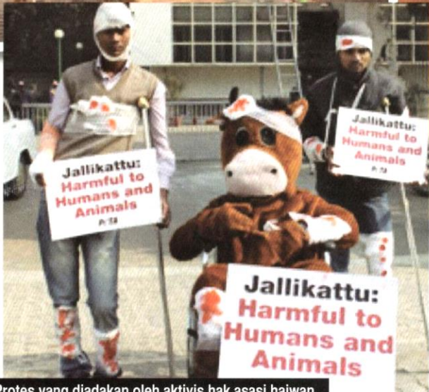
Protes yang diadakan oleh aktivis hak asasi haiwan.

Namun begitu, akibat protes besar-besaran, pemerintah Tamil Nadu meluluskan pindaan terhadap Akta Pencegahan Kekejaman terhadap Haiwan 1960 untuk membenarkan semula sukan Jallikattu dijalankan. Pindaan tersebut kemudiannya dipersetujui oleh Presiden India dan secara