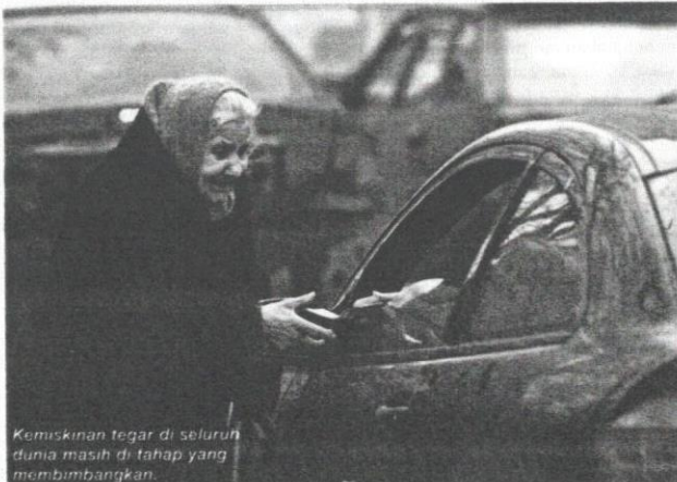
Kemiskinan tegar di seluruh dunia masih di tahap yang membimbangkan.

Melihat dapatan kajian ini, dapat dikaitkan beberapa insiden bunuh diri sejak akhir-akhir ini yang melibatkan anak-beranak daripada keluarga yang miskin yang kebanyakannya berlaku di penempatan miskin di bandar. Kes yang dilaporkan dalam Mingguan Malaysia (14 Julai 2007) mengenai kematian tiga beranak kerana terminum racun di sebuah pangsupuri di Jalan Kelang Lama, Kuala Lumpur, mungkin boleh menjadi contoh terkini yang dapat menjadi rujukan berhubung dengan masalah kemiskinan dan penempatan miskin. Sebab-sebab berlakunya kejadian seperti di atas, selain faktor kemiskinan ialah semangat kejiranan yang begitu rapuh dan perkhidmatan sokongan yang sukar dan susah dicapai