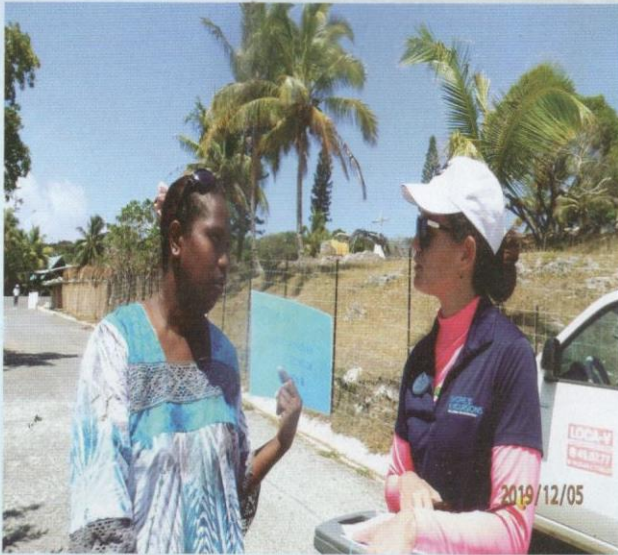
Pemandu pelancong menunjukkan jalan kepada pelancong asing.

bercuti, dan terlepas daripada ikatan dan peraturan kebiasaan harian.