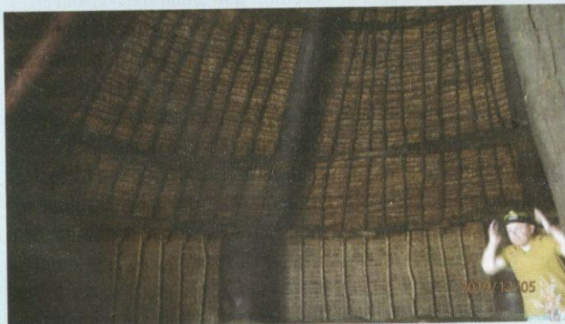
Keseluruhan rumah diperbuat daripada kayu dan nipah.

Ruang dalam rumah mesyuarat agak gelap kerana dibina tanpa tingkap. Hanya pintu hadapan sahaja digunakan untuk keluar atau masuk. Cukup menarik, walaupun tidak jelas konsep