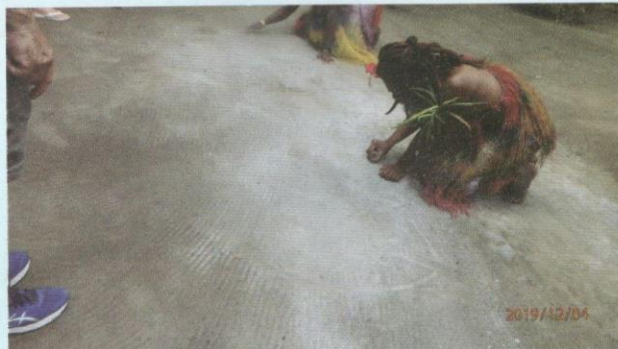
Melukis di tanah untuk menyampaikan pesan.

Setelah itu, kami berkeliling dalam taman herba suku ini. Berbagai-bagai herba untuk dijadikan ulam, sayur dan ubat-ubatan ditunjuk. Kami turut dipelawa untuk mencubanya.