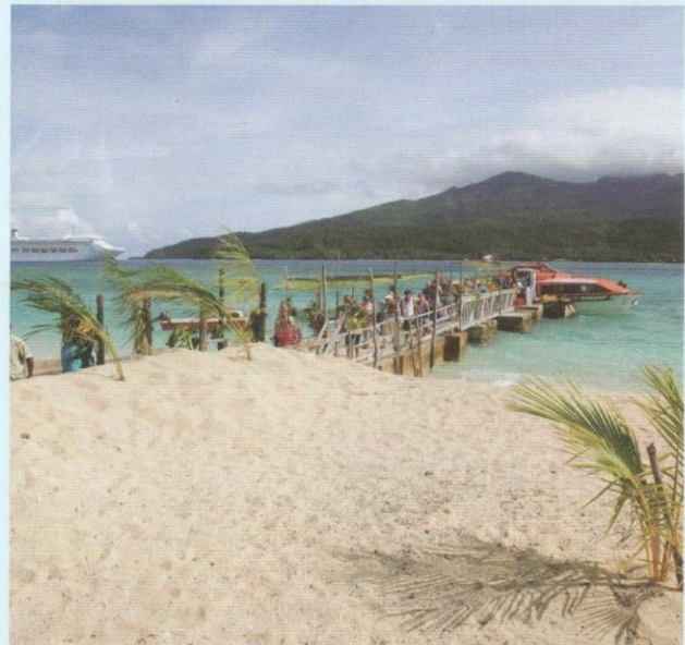
Persisiran pantai Mystery Island.

Pintu keluar-masuknya hanya satu, dan bangunan ini tiada bertingkap pula. Jadi agak kelam. Pintunya rendah dan setiap orang yang masuk perlu tunduk, seperti menghormati penghulu mereka. Ruang ini dianggap sebagai rumah suci dan mulia. Di sinilah diadakan debat dan perbincangan tentang hal ehwal masyarakat mereka. Terlihat ada semacam unsur demokratik di sini.