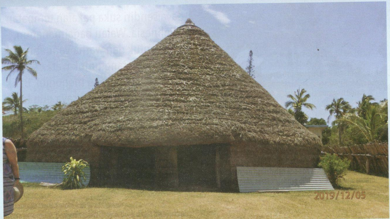
Rumah mesyuarat penduduk kampung Natalo.

Ruang dalam rumah mesyuarat agak gelap kerana dibina tanpa tingkap. Hanya pintu hadapan sahaja digunakan untuk keluar atau masuk. Cukup menarik, walaupun tidak jelas konsep