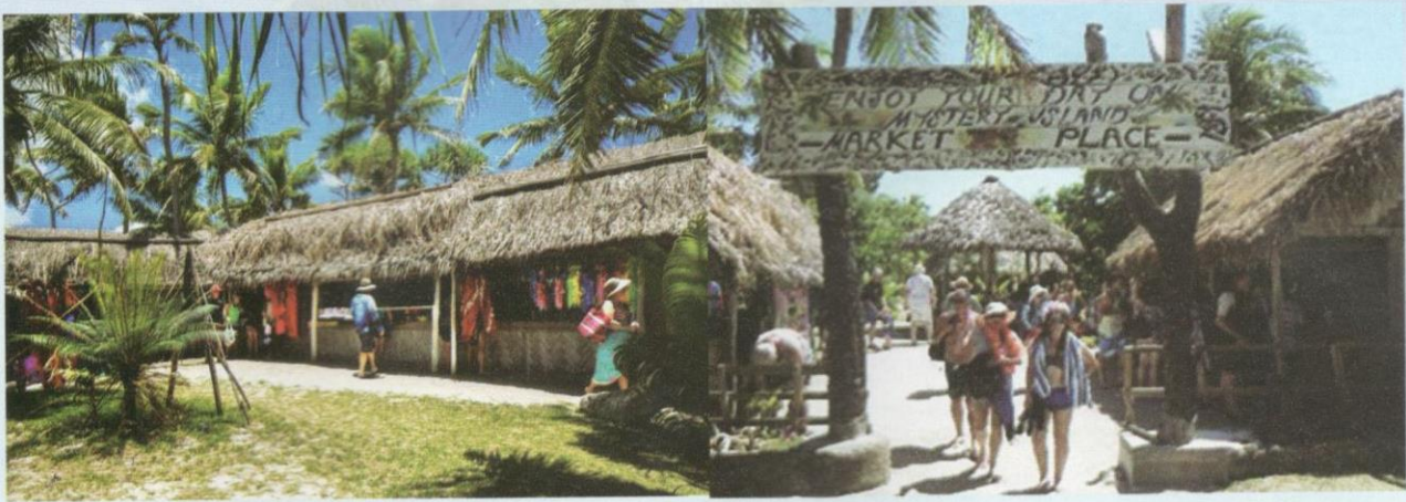
Pasar Pelancong di Anatom.

Waktu untuk pulang ke kapal sudah tiba. Maka itu, kami pun segera dibawa untuk menghabiskan wang moden kami di warung-warung pakaian, kalung dan kraf penduduk tempatan. Asli dan tidak diimport.