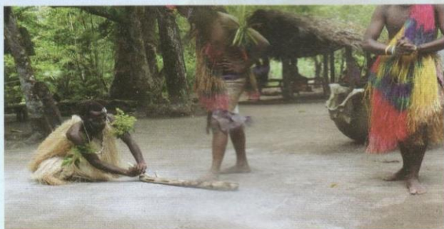
Demonstrasi menghidupkan api.

300 orang dalam satu serangan sahaja. Masyarakat Mystery Island ini tidak menangkap dan memenggal kepala anak-anak dan orang perempuan, tetapi alat pemusnah – iaitu bom moden – membunuh semuanya, dan memusnahkan kampung dan kota serta persekitarannya tanpa pengecualian.