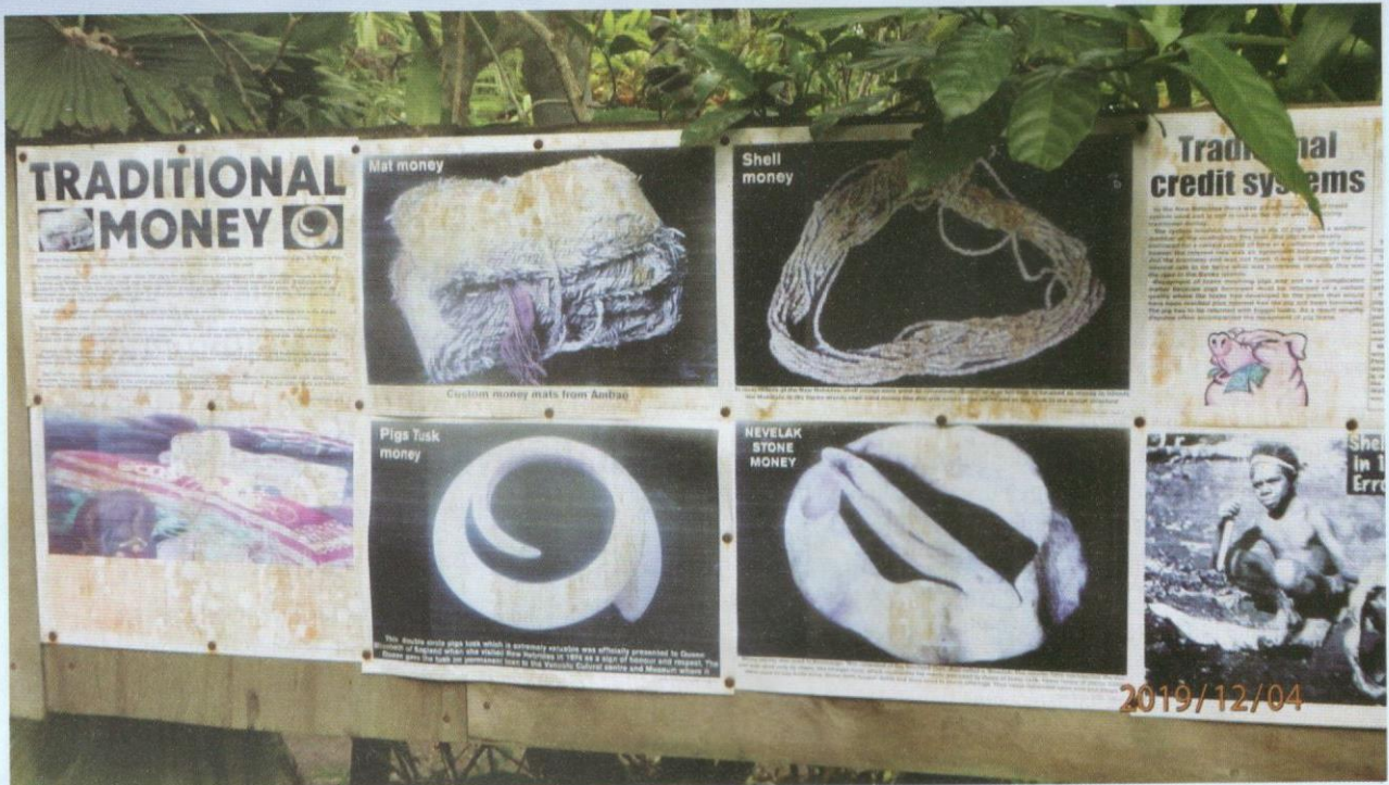
Jenis wang tradisional yang digunakan oleh penduduk di sini.

sementara pelukisnya tiada di tempat. Orang yang datang atau pulang itu akan membaca rajahnya. Lukisan ini lebih dekat kepada rajah. Di dalamnya dimasukkan maklumat tentang orang yang pergi itu, arahnya, waktu dia berangkat dan pulang. Yang menariknya, lukisan ini bukan berbentuk aksara, tetapi dengan memuatkan maklumat yang perlu dan difahami bersama, tanpa aksara dari luar.