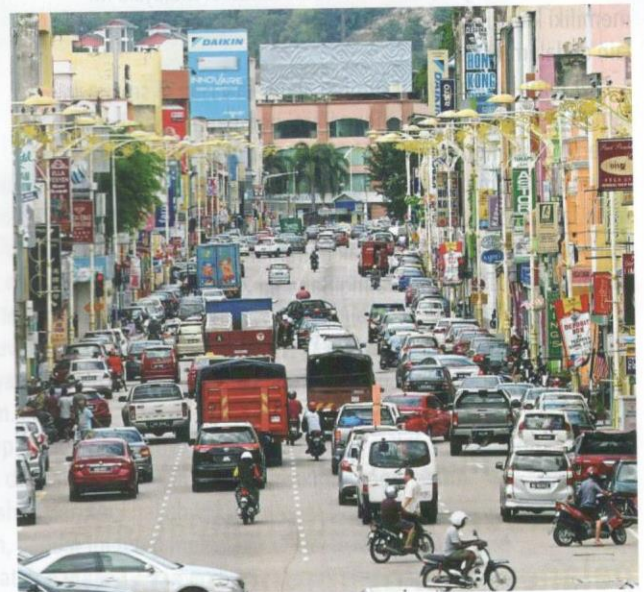
Bandar Taiping yang padat dan aktif.

berlangsung pada 7 Jun 2020 yang lalu yang mempertemukan lebih daripada 20 bandar dan bandar raya dari seluruh negara Asia Pasifik secara maya. Melalui seminar ini, para peserta memberikan pandangan dan penjelasan berkaitan dengan kesukaran yang dilalui dan perkembangan terkini sektor pelancongan akibat penularan wabak COVID-19.