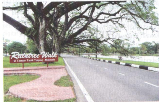
Taman Tasik Taiping menjadi lokasi tarikan pelancong di Taiping.

Sepanjang tempoh penularan wabak COVID-19 yang melanda negara baru-baru ini, tidak dapat dinafikan bahawa aktiviti pelancongan di Perak, khususnya di Taiping, terjejas susulan larangan untuk melancong di dalam dan di luar negara. Namun