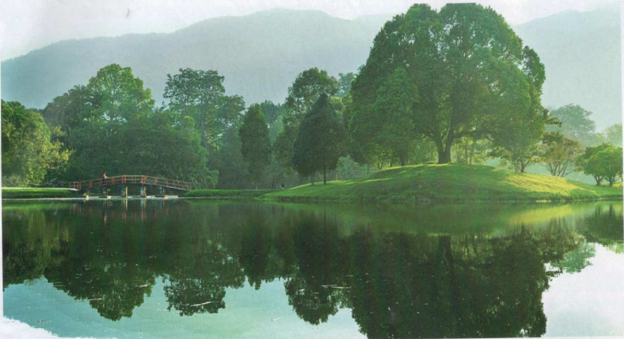
Taman Tasik Taiping merupakan taman rekreasi pertama di Malaysia.

COVID-19 ini dilihat semakin berkurangan dan kedatangan musim buah-buahan yang menyebabkan kesesakan lalu lintas dalam bandar Taiping.