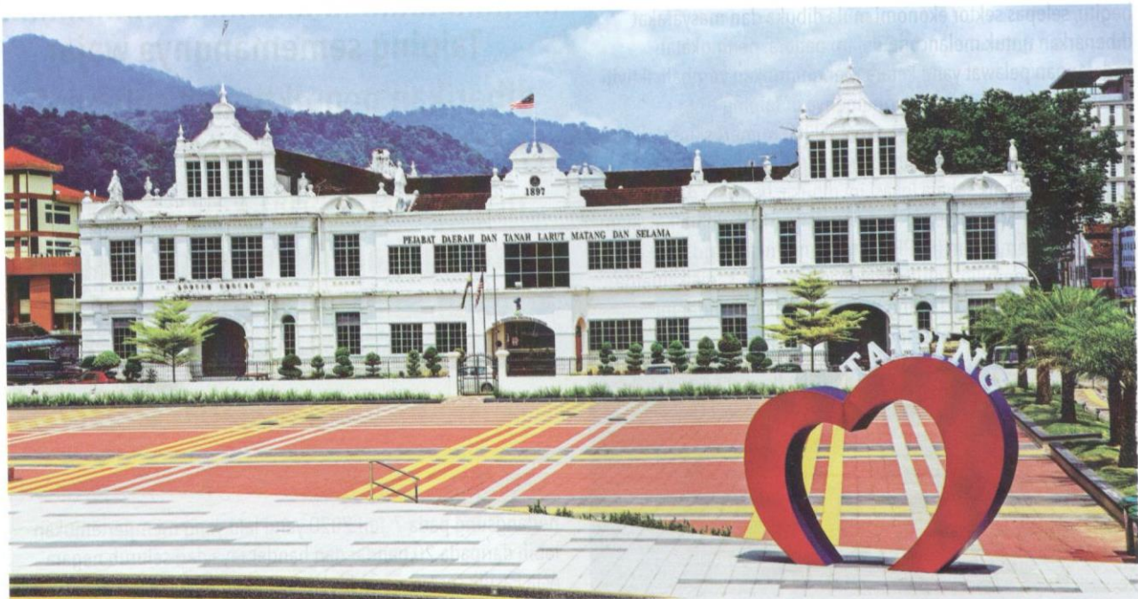
Bangunan Pejabat Daerah dan Tanah Larut Matang dan Selama berusia 123 tahun.

MPT. Menurut kajian yang dijalankan oleh Institut Penyelidikan Perhutanan Malaysia, taman rekreasi tertua di Malaysia ini memiliki kira-kira 113 pokok hujan-hujan dan 1300 jenis pokok lain di dalamnya.