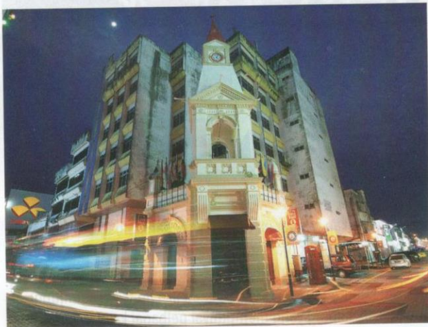
Menara jam Taiping yang masih kekal reka bentuknya.

Perkembangan positif ini dapat dilihat menerusi jumlah kedatangan pelawat melebihi 25 ribu orang ke Zoo Taiping & Night Safari sebaik sahaja lokasi ini dibuka, bermula dari 15 Jun sehingga 30 Jun 2020. Susulan daripada Perintah Kawalan Pergerakan Pemulihan (PKPP) yang diumumkan baru-baru ini, orang ramai memilih untuk berekreasi bersama-sama keluarga dengan melancong ke Taiping memandangkan bandar ini memiliki kekayaan alam semula jadi dan sejarah.