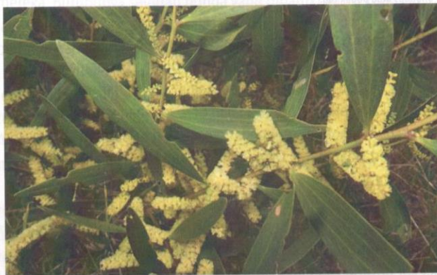
Acacia longifolia .

Kini, di Sydney, saya menerima sebuah hadiah alam yang luar biasa yang tidak saya alami di negara-negara lainnya, terutama sewaktu taman ini merayakan usia 200 tahunnya. Untuk ke sana, kita hanya perlu berjalan kaki di tepi tembok Opera House, di pinggir Farm Cove, di sebelah timur kawasan pusat perniagaan Sydney, dan dibentangkan di tepi tebing pelabuhan yang bergelombang rendah. Dari puncak taman ini, kita seterusnya dihadihkan pemandangan Sydney Harbour yang panoramik.