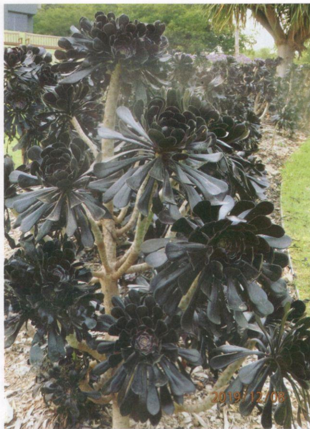
Daun atau bunga?

Dua orang ahli botani, Banks dan Solander, mengumpul spesimen di berbagai-bagai kawasan daerah Teluk Botani ini. Yang menariknya, sebahagian daripada yang dikumpulkan mereka, iaitu sekitar 200 tahun yang lalu, masih tumbuh subur di taman ini.