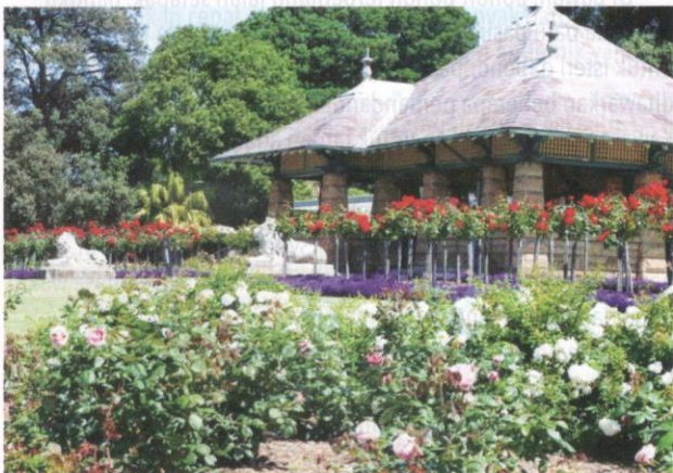
Taman Botani Diraja Sydney mempunyai lebih satu juta spesimen tumbuhan.

Dua orang ahli botani, Banks dan Solander, mengumpul spesimen di berbagai-bagai kawasan daerah Teluk Botani ini. Yang menariknya, sebahagian daripada yang dikumpulkan mereka, iaitu sekitar 200 tahun yang lalu, masih tumbuh subur di taman ini.