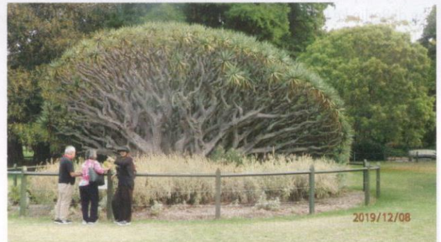
Pandanus atau pudak tua.

Antara spesimen tersebut termasuklah Woolisia pungens , Actinotus helianthi , (Flannel Flower) dan Angophora costata (The Sydney Red Gum). Di Malaysia, kita lebih mengenali akasia yang tumbuh di mana-mana daripada bibit Australianya, malah di rumah saya juga. Di Australia, pohon "gum", iaitu sejenis gelam, paling hadir dan kelihatan di mana-mana. Di sebelah selatan kota ada sebidang hutan pohon gelam ini yang mengelupas kulitnya pada hujung musim panas. Di Indonesia, inilah pohon yang memberikan kita minyak kayu putih. Namun begitu, pohon ini sangat merbahaya pada musim panas pada waktu hutan sering terbakar kerana kandungan minyaknya itu. Api pembakaran besar-besaran yang berlaku di Indonesia sebahagiannya ialah sumbangan minyak ini juga.