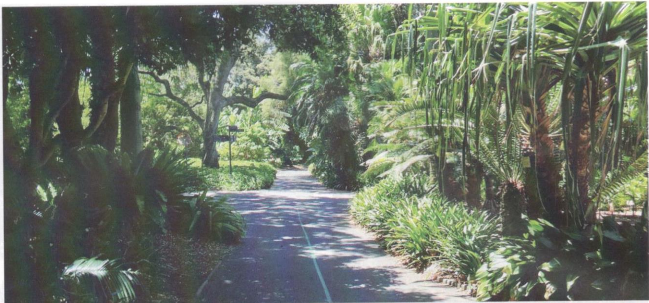
Beberapa pokok seperti pokok pudak, bogak, pinang dan pandan yang kita kenali.