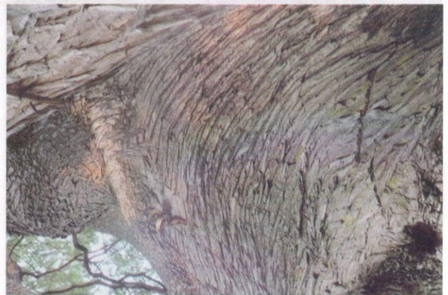
Pada kulit ada tanda waktu.

Taman ini didirikan pada tahun 1816 dan yang pertama pula di Australia. Keluasannya ialah 158 ekar, dan terletak di tepi pelabuhan dan selat yang indah. Pemandangannya luar biasa;