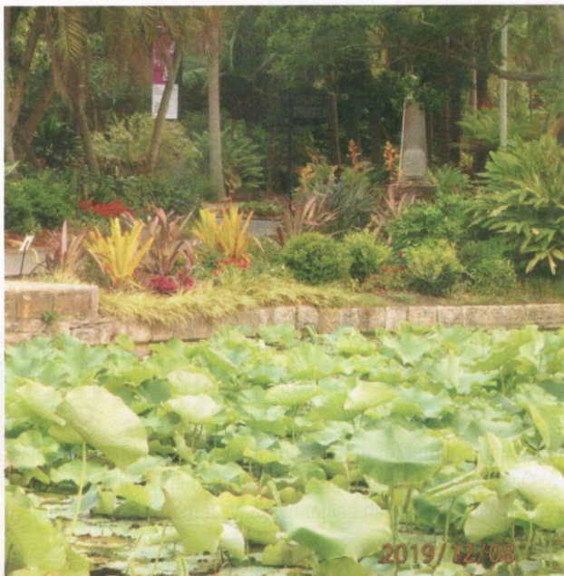
Seroja subur di kolam.

pohon ini, bukan sahaja menunjukkan teksturnya yang luar biasa, tetapi juga usianya yang tidak kurang daripada 200 tahun itu. Ada cukup banyak pohon tua dengan kulit berkedutnya! Sebatang pudak (pandanus) yang juga cukup tua berdiri seperti kipas di kejauhan. Semua ini membuat kita berasa kecil di bumi yang luas dan harus dikongsi oleh jutaan spesies.