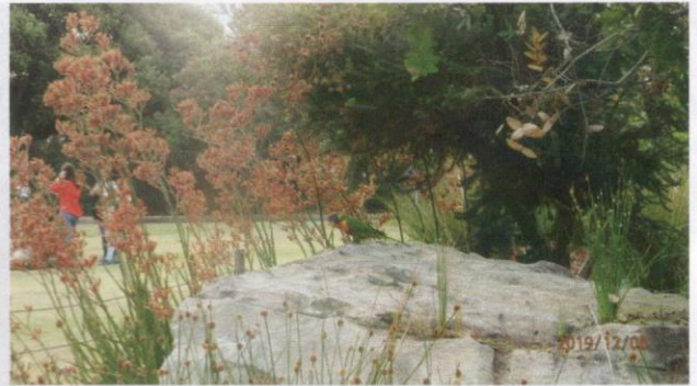
Burung kakak tua dan bunga.

Antara spesimen tersebut termasuklah Woolisia pungens , Actinotus helianthi , (Flannel Flower) dan Angophora costata (The Sydney Red Gum). Di Malaysia, kita lebih mengenali akasia yang tumbuh di mana-mana daripada bibit Australianya, malah di rumah saya juga. Di Australia, pohon "gum", iaitu sejenis gelam, paling hadir dan kelihatan di mana-mana. Di sebelah selatan kota ada sebidang hutan pohon gelam ini yang mengelupas kulitnya pada hujung musim panas. Di Indonesia, inilah pohon yang memberikan kita minyak kayu putih. Namun begitu, pohon ini sangat merbahaya pada musim panas pada waktu hutan sering terbakar kerana kandungan minyaknya itu. Api pembakaran besar-besaran yang berlaku di Indonesia sebahagiannya ialah sumbangan minyak ini juga.