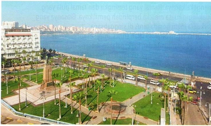
Teluk Iskandariah pada masa ini.

berbilik dan bertingkat ganda – berkemungkinan besar rumah orang kaya. Berderet-deret di tepi sungai, di lokasi paling dicari di tengah kota. Inilah daerah mahal dan suka berdandan.