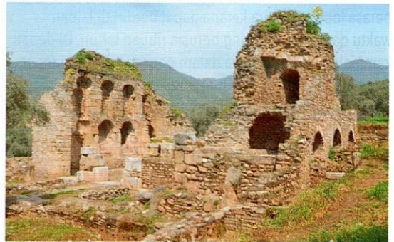
Runtuhan Perpustakaan Iskandariah yang asal.

Sebab terbakarnya perpustakaan ini ialah rahsia zaman. Ada yang mengatakan bahawa Julius Caesarlah yang membakar ribuan manuskrip yang terkumpul di sana, dan ada pula yang menyebut bahawa penakluk Uthmaniah yang menjadi pemusnahnya. Tetapi sayang, kini buktinya hanya ada pada catatan mereka yang pernah membaca di sana dan juga pengkaji sejarah perpustakaan itu.