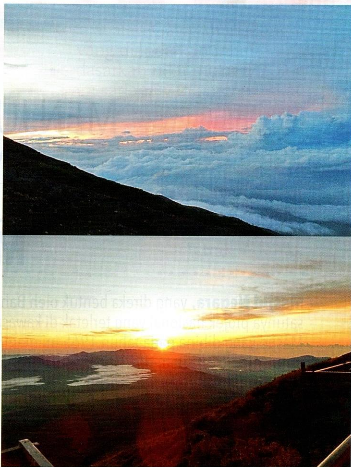
Keindahan panorama Gunung Fuji.