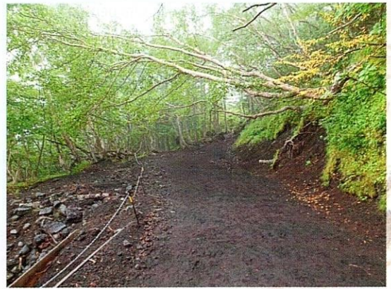
Laluan mendaki Gunung Fuji.

Pada ketika itu, mula terbayang di benak penulis, berita seorang ibu terjatuh ketika mendaki Gunung Fuji. Perasaan seram sejuk dan keinginan untuk berpatah balik sangat tebal di dalam hati. Kemudiannya, perlahan-lahan penulis mendengar suara rakan memanggil. Mungkin dia pun berasa takut. Namun