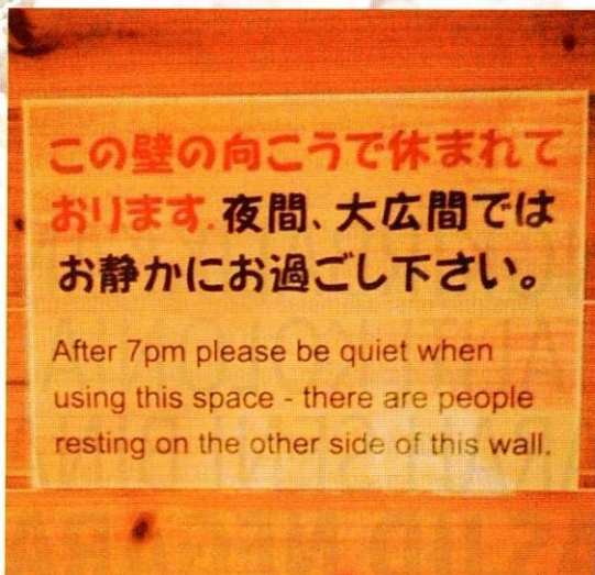
Pengunjung dinasihatkan tidak membuat bising di stesen penginapan.