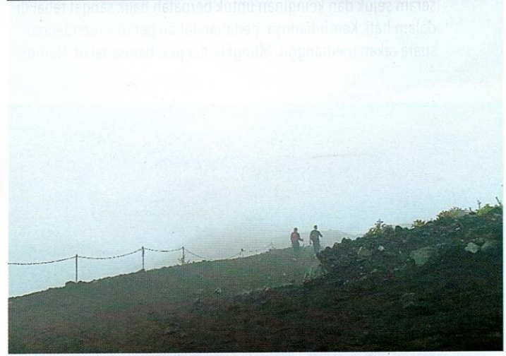
Kabus tebal ketika mendaki Gunung Fuji.