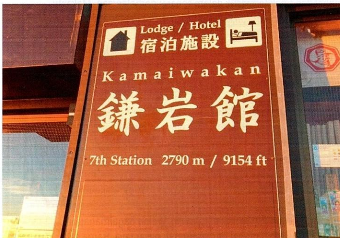
Stesen penginapan untuk pendaki merehatkan diri di Gunung Fuji.

begitu, tidak lama selepas itu, tiba-tiba cuaca menjadi cerah dan kelihatan pendaki lain, seolah-olah kabus ditiup jauh dari kawasan pergunungan itu.