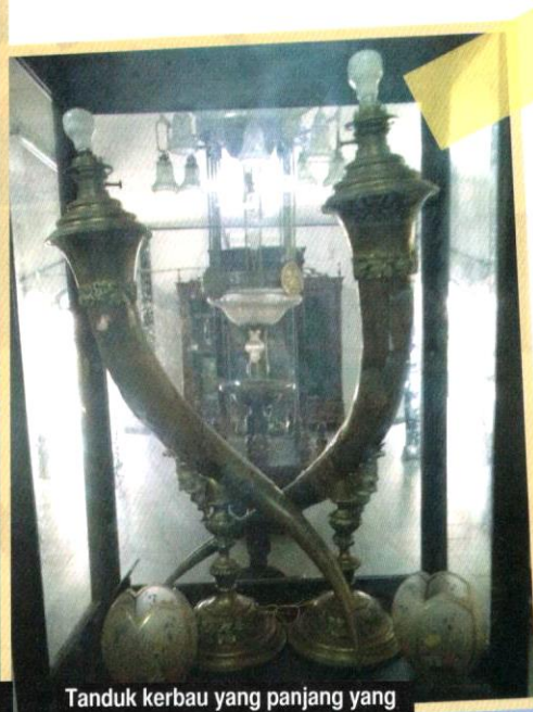
Tanduk kerbau yang panjang yang terdapat dalam muzium tersebut.

tukar buku. Choen menghadiahkan penulis dua buah buku puisi Di Antara Perempuan, sementara penulis pula menghadiahkannya sebuah buku pantun dan sebuah buku sonigraf yang diselenggara oleh Tabir Alam.