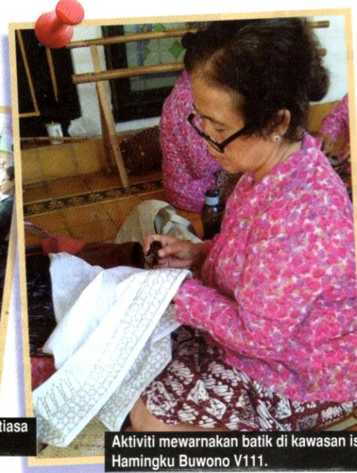
Aktiviti mewarnakan batik di kawasan istana Hamingku Buwono V111.