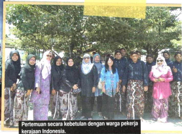
Pertemuan secara kebetulan dengan warga pekerja kerajaan Indonesia.

motosikal yang dibawa laju. Di sini memerlukan ketelitian dan kesabaran semasa mengendalikan kenderaan. Penulis berasa risau apabila melihat motosikal yang dibawa dalam keadaan yang berbahaya. Penunggang motosikal di sini gemar berhenti dengan rapat sewaktu lampu merah menyala dengan kenderaan kami. Setiap jalan yang dilalui semuanya sibuk dengan kenderaan yang memenuhi jalan, di samping kelihatannya begitu tergesa-gesa untuk sampai ke destinasi masing-masing.