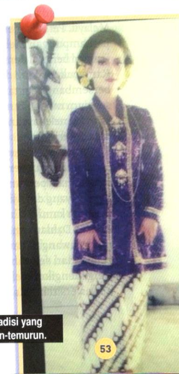
Kerabat diraja menggayakan pakaian tradisi yang menjadi kebanggaan mereka sejak turun-temurun.