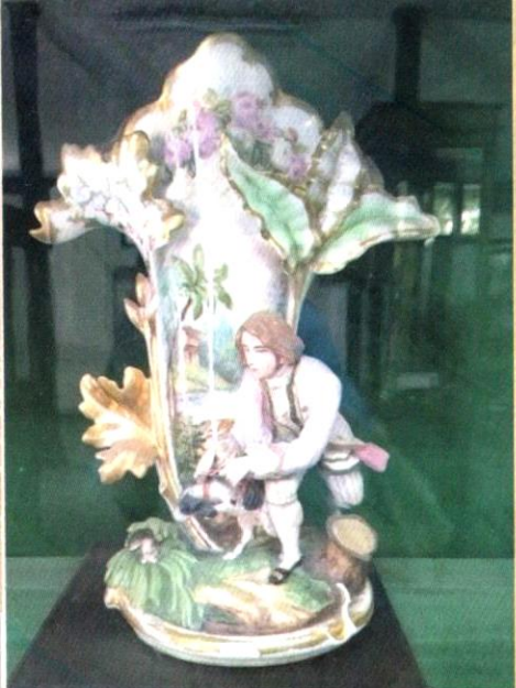
Pasu bunga porselin yang terdapat di dalam muzium karaton Ngayogyakarta Hadiningrat.