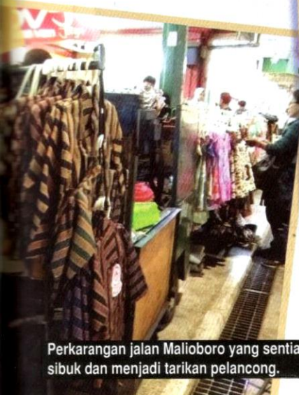
Perkarangan jalan Malioboro yang sentiasa sibuk dan menjadi tarikan pelancong.

Pada keesokannya, kami dijemput oleh Kang Yanto untuk bersarapan dan terus ke lapangan terbang. Sambil mengucapkan selamat tinggal, kami menghulurkan lebihan wang Rupiah dengan ihsas kepada Kang Yanto. Tidak terduga pula selepas kembara ini, kami terpaksa berada dalam negara tanpa kembara setelah COVID-19 melanda seluruh dunia. Kenangan indah berada di Yogyakarta tetap terpahat di hati dan menjadi abadi dalam memori. DB