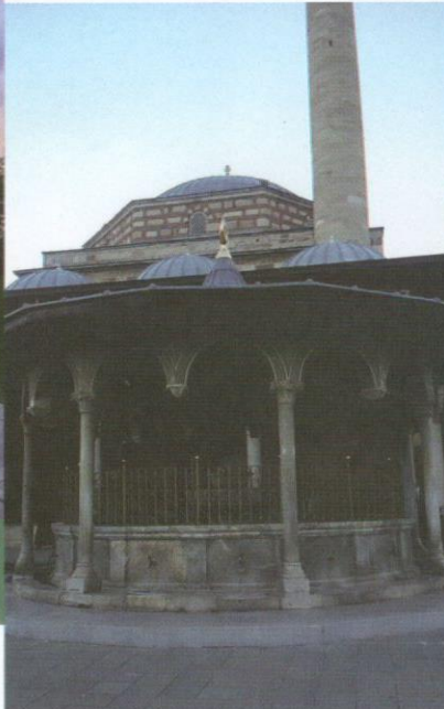
Tempat berwuduk yang masih boleh digunakan sehingga kini.

Selain makam Ar-Rumi, ada juga makam keluarga, anak-anak murid dan para pengikutnya di pekarangan kompleks. Yang turut dipamerkan