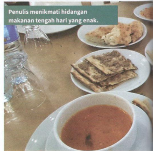
Penulis menikmati hidangan makanan tengah hari yang enak.