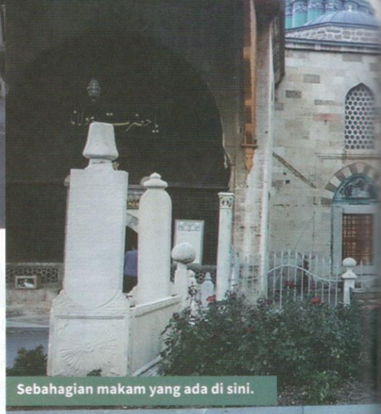
Sebahagian makam yang ada di sini.