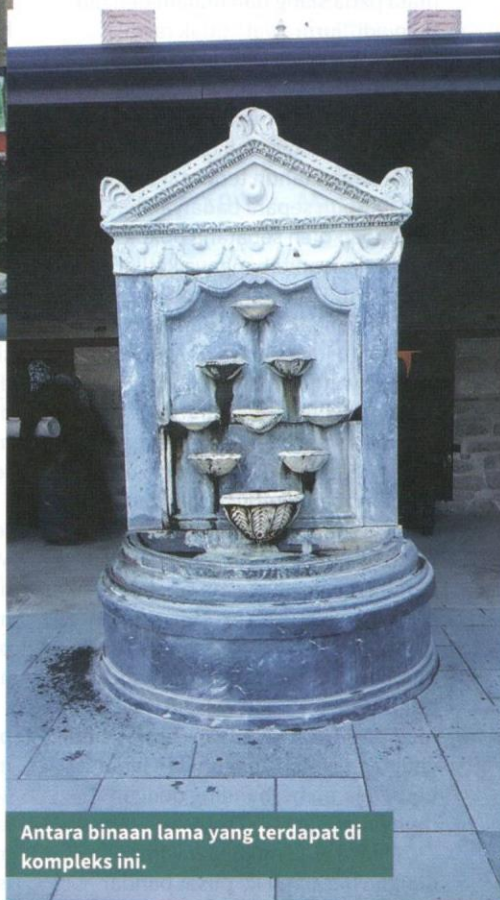
Antara binaan lama yang terdapat di kompleks ini.