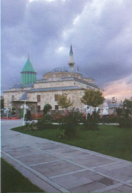
Kompleks makam ar-Rumi yang sekali pandang seakan-akan masjid Haya Sofia di Istanbul.

pengunjung masih boleh melawat tempat berkenaan. Dengan melewatinya bagaikan berkunjung ke sebuah istana yang dikelilingi oleh taman yang sangat cantik. Sesekali haruman mawar menyapa dan memberikan aura segar. Tidak dapat kugambarkan betapa indahnya taman ini pada musim bunga.