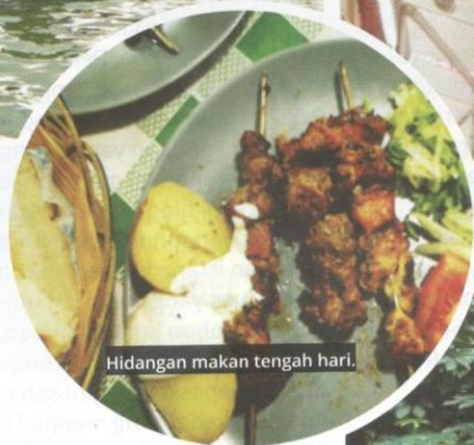
Hidangan makan tengah hari.

kerana di sinilah bermulanya sejarah pembukaan pelabuhan oleh seorang pahlawan Islam yang bernama Tariq bin Ziyad.