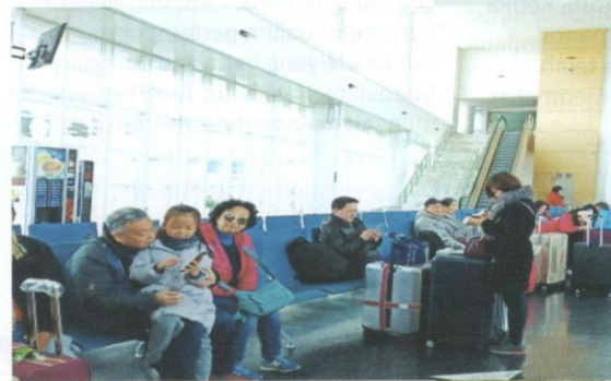
Kami berkumpul di Port Tangier sebelum menyeberangi Ke Port Tarifa.

Kami berada di situ hingga pukul 9.00 malam. Oleh sebab pada waktu ini masih pada awal tahun, kelihatan para remaja masih merayakan tahun baharu. Mereka bersantai di kedai minuman, berpesta sambil minum arak. Kami juga dibawa ke Giralda Tower, menara loceng yang memiliki ketinggian kira-kira 105 meter dan didirikan pada tahun 1198. Menara ini menyerupai menara masjid yang tidak siap yang terdapat di Morocco yang dibina oleh Sultan Hasaan. Untuk sampai ke puncak menara, pelancong harus menaiki tangga dari satu tingkat ke satu tingkat hingga ke atas. Giralda Tower sebuah tempat untuk melihat keindahan kota Seville dari aras yang tinggi.