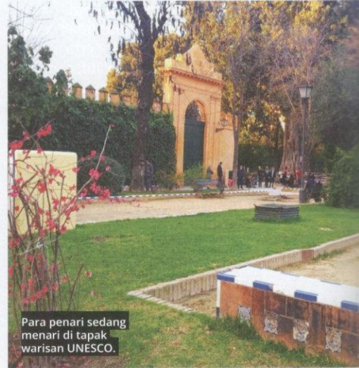
Para penari sedang menari di tapak warisan UNESCO.

Selat Gibraltar atau Estrecho de Gibraltar ialah selat yang memisahkan Lautan Atlantik dan Laut Mediterranean. Selat Gibraltar terletak di utara Sepanyol dan bahagian selatannya ialah Maghribi. Selat ini mempunyai lokasi yang sangat strategik dan mempunyai kedalaman sekitar 300 meter dan lebar sekitar 14 kilometer pada sisi tersempitnya.