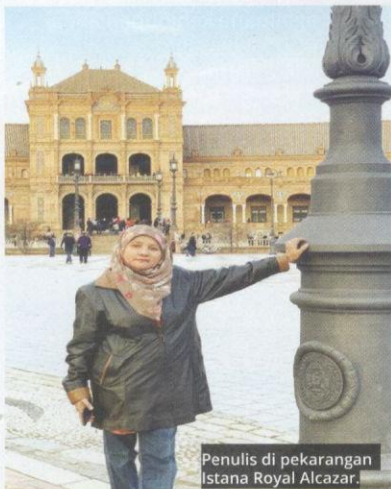
Penulis di pekarangan Istana Royal Alcazar.

Kemudian, kami menyeberangi Selat Gibraltar dan menikmati udara nyaman di atas feri yang penuh penumpang dari Maghribi (Morocco)