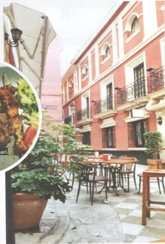
Hotel mewah di bangunan lama di Seville.