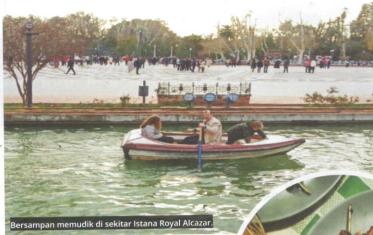
Bersampan memudik di sekitar Istana Royal Alcazar.