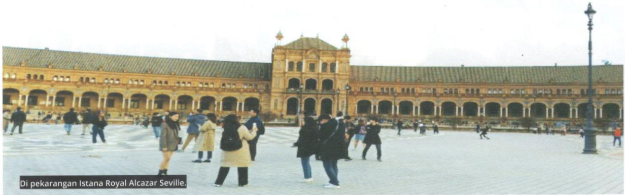
Di pekarangan Istana Royal Alcazar Seville.

henti-henti menceritakan tentang sejarah di sini yang kebanyakannya orang Islam. Akibat takut dipulaukan dan ditindas oleh pemimpin Kristian, mereka terpaksa berpura-pura sebagai orang Kristian. Ketika itu, mereka dipaksa minum arak tetapi masih mengerjakan solat dan sebagainya apabila kembali ke rumah mereka.