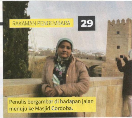
Penulis bergambar di hadapan jalan menuju ke Masjid Cordoba.