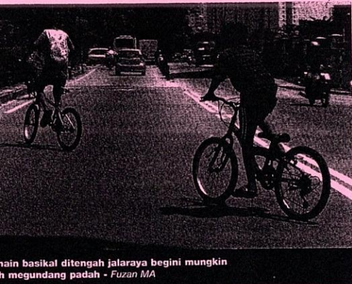
main basikal ditengah jalaraya begini mungkin mengundang padah - Fuzan MA

Malangnya, di ketika- ketika tertentu, kepadatan pula para pemandu kenderaan persendirian lain yang seperti sengaja menempah maut, memandu dan memecut bagaikan lipas kudung, menyelit dan meliuk-liuk di tengah kesesakan jalanraya, memotong sesuka hati dari kiri dan kanan, membelok tanpa memberi isyarat, keluar simpang tanpa memandang papan peringatan, memecut di luar had laju; atau bahkan yang mengubahsuai kenderaan masing-masing hingga terlepas dari spesifikasi keselamatan.