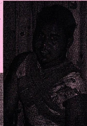
Dua beradik yang menjadi mangsa kemalangan jalan raya

Lebih mendukakan hati kita, apabila terkesan oleh kita betapa para mangsa kemalangan itu sebenarnya tidak perlu atau tidak harus terlibat. Mereka sama sekali tidak berada pada posisi patut berlaku kemalangan.