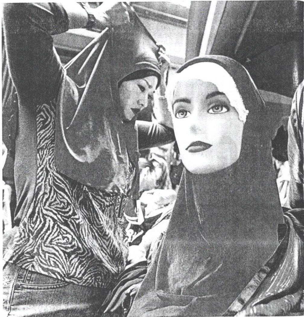
GOLONGAN wanita mempunyai kuasa beli yang tinggi.

Di Malaysia, wanita merupakan 48.7 peratus daripada jumlah penduduk dan merupakan modal insan yang penting dalam menjana pembangunan negara. Meskipun demikian, kajian Kementerian Wanita dan Pembangunan Keluarga dan Masyarakat (2004) menunjukkan hanya 9.9 peratus sa-