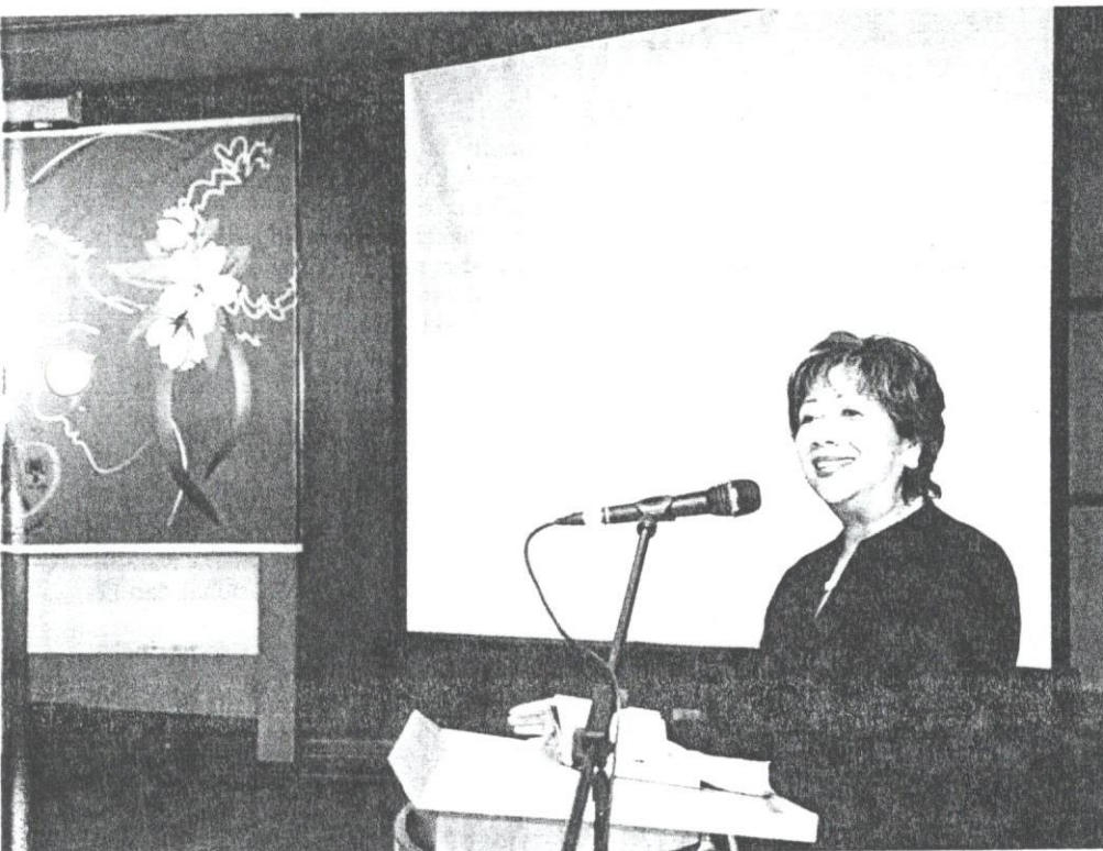
DATO' DR. NORRAESAH semasa memberikan ucapan utama dalam Dialog Dewan Masyarakat baru-baru ini.