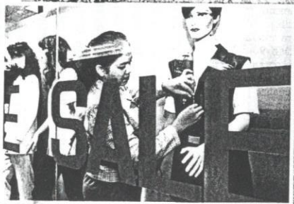
PENYERTAAN wanita sebagai tenaga buruh sangat diperlukan negara.

Oleh sebab itu, berdasarkan hak wanita atau kesaksamaan jantina, pengambilan