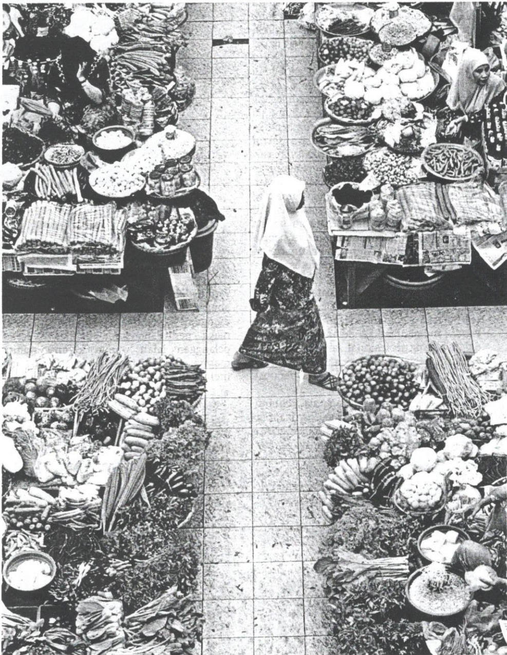
PELUANG wanita menceburi bidang perniagaan dalam RMK-9 terbuka luas.