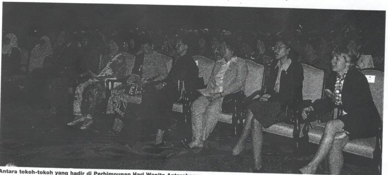
Antara tokoh-tokoh yang hadir di Perhimpunan Hari Wanita Antarabangsa

Walaupun Negara kita telah menggubal dan melaksanakan Akta Keganasan Rumah Tangga sejak 1994, kes-kes keganasan rumah tangga masih membimbangkan. Sepanjang 2006 sebanyak 3,264 kes telah dilaporkan. Malangnya, kes keganasan rumah tangga sering dianggap sebagai masalah peribadi. Akibatnya mangsa mengalami penderaan secara berterusan tanpa mendapat perhatian masyarakat.