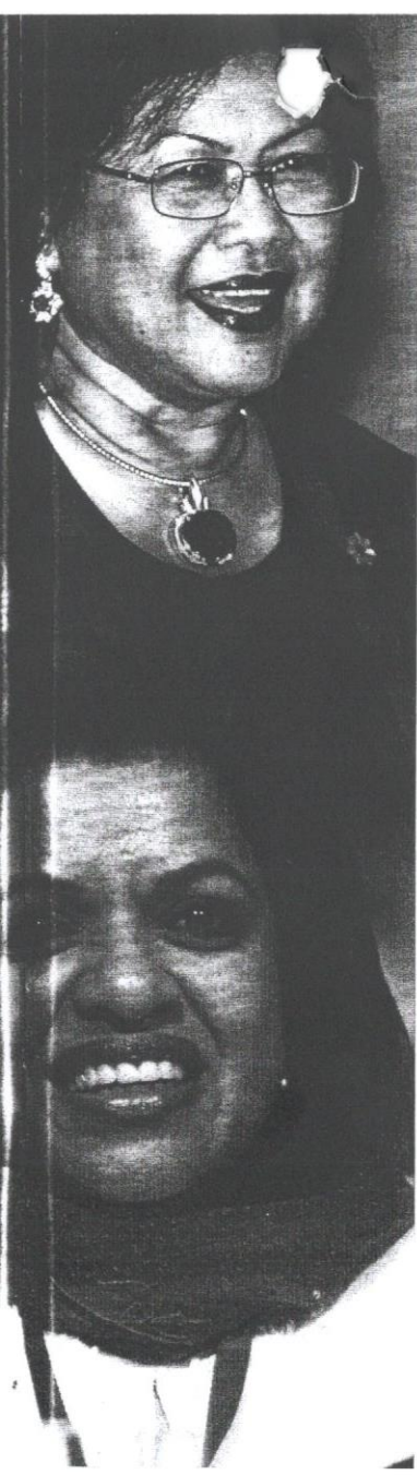
Jadual Sumbangan wanita era kini.