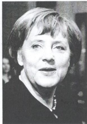
Angela Dorothea wanita yang pertama memegang jawatan Canselor, Jerman.

Pada tahun 2007, Angela juga memegang jawatan Presiden Badan Eropah dan sekapatan G8. Beliau memainkan peranan utama dalam perundangan keamanan antara pengisytiharan Lisbon dan Berlin. Untuk polisi tempatan pula, beliau menumpukan perhatian yang lebih pada bahagian kesihatan penduduk dan masalah dalam pembangunan tenaga untuk masa hadapan.