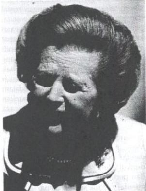
Margaret Thatcher dikenal sebagai wanita besi.

Pada peringkat antarabangsa pula, tokoh ekonomi banyak yang terdiri daripada golongan wanita. Antaranya, Margaret Hilda Thatcher, seorang wanita unggul dalam bidang politik dan ekonomi dari Great Britain. Beliau memegang jawatan sebagai Perdana Menteri United Kingdom sejak tahun 1979 sehingga tahun 1990 dan Ketua Parti Konservatif sejak tahun 1975 sehingga tahun 1990. Margaret Thatcher merupakan wanita