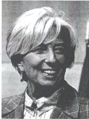
Christine Lagarde pakar ekonomi Perancis.

Pada tahun 1987, beliau dilantik bagi penggal yang ketiga untuk memerintah Great Britain. Ketika itu, beliau semakin tidak popular dan situasi semakin sukar. Margaret Thatcher meletakkan jawatan sebagai Perdana Menteri Great Britain pada tahun 1990, apabila Michael Heseltine mencabar pucuk pimpinan beliau dalam Parti Konservatif. Tempoh pemerintahan beliau adalah yang terpanjang semenjak zaman Lord Salisbury dan Lord Liverpool pada awal abad