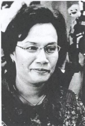
Sri Mulyani Indrawati pakar ekonomi Indonesia.

Kewibawaan Sri Mulyani semakin terserlah apabila beliau berjaya menaikkan jumlah pelaburan langsung asing (FDI) Indonesia. Pada tahun 2004, tahun pertama bagi Presiden Susilo Bambang Yudhoyono sebagai Presiden Indonesia, negara itu menerima AS$6.4 bilion (RM22.4 bilion) daripada FDI. Tahun selepas itu, yakni setelah beliau menjadi Menteri Kewangan, Indonesia menerima sebanyak AS$8.9 bilion (RM31.15 bilion).