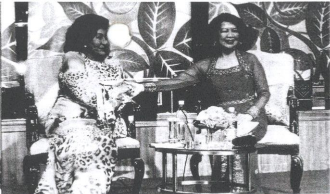
Datin Sri Rosmah Mansor membawa Global Summit of Women ke Kuala Lumpur.

Berhad, dan Kumpulan Wang Simpanan Pekerja telah menyahut saranan dan usaha baik kerajaan dengan melantik tiga orang pengarah wanita.