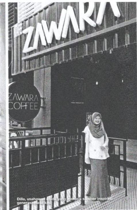
Dilla, usahawan muda yang menjadi sumber inspirasi generasi muda.