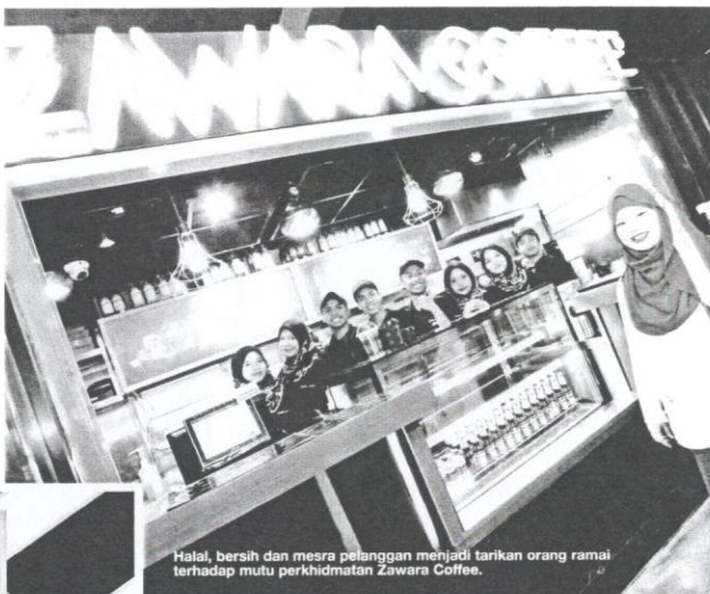
Halat, bersih dan mesra pelanggan menjadi tarikan orang ramai terhadap mutu perkhidmatan Zawara Coffee.

Daripada pengalaman dan ilmu yang diperoleh sepanjang berniaga kecekilian