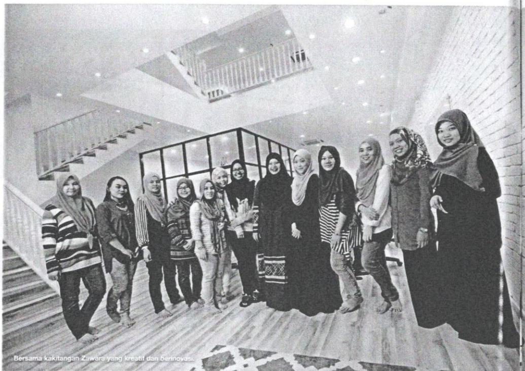
Bersama kakitangan Zawara yang kreatif dan berinovasi.