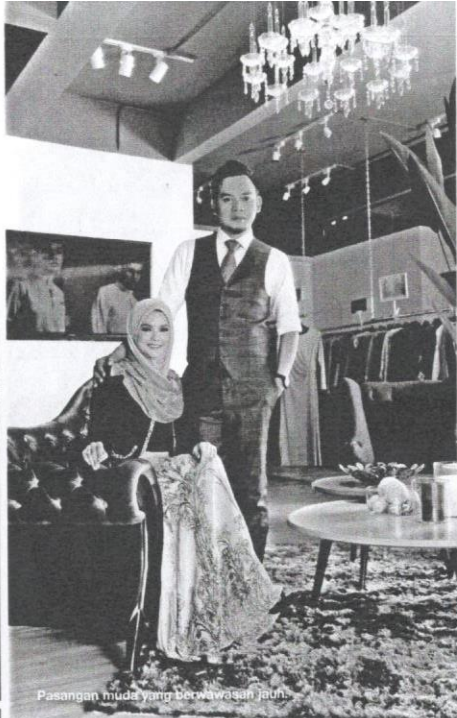
Pasangan muda yang berwawasan jauh.