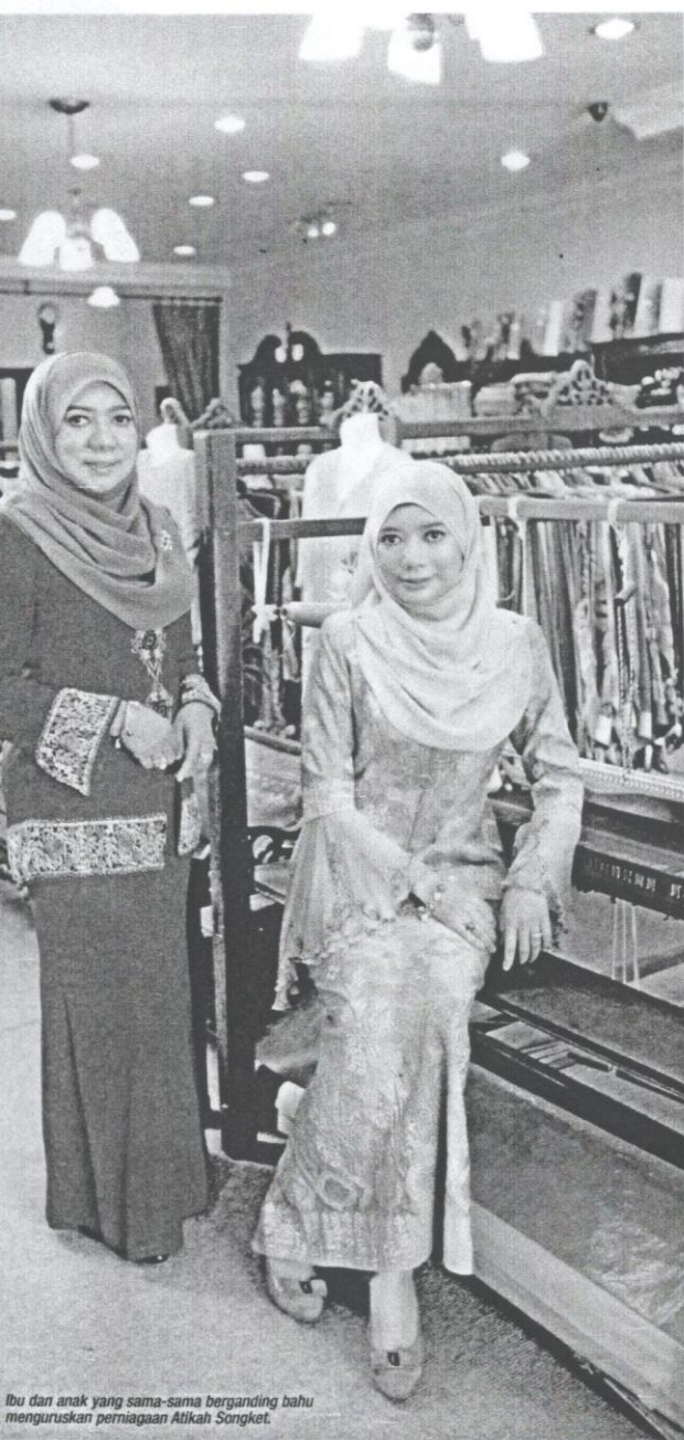
Ibu dan anak yang sama-sama berganding bahu menguruskan perniagaan Atikah Songket.