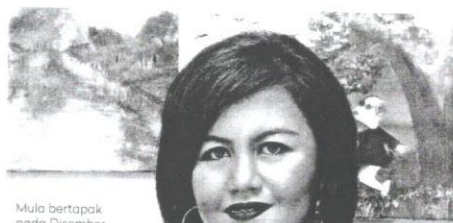
Mula bertapak pada Disember 2016, Aishah turut berkolaborasi bersama Bright Kids, Kota Damansara dan UIA Gombak.

"Biarpun ada pihak yang cuba memadamkan api semangat dengan mengatakan saya tidak boleh berjaya