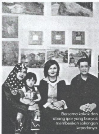
Bersama kakak dan abang ipar yang banyak membenarkan sokongan kepadanya.