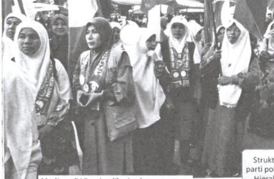
Muslimat PAS wajar diberi peluang yang lebih terbuka.