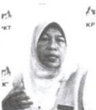
Zuraida Kamaruddin Menteri Perumahan dan Kerajaan Tempatan