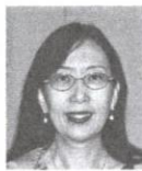
Teresa Kok Suh Sim Menteri Industri Utama