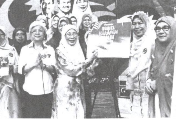
Wanita perlu diberi peluang sebagai pembuat keputusan.