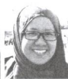
Isnaraissah Munirah Majilis@Fakharudy Timbalan Menteri Tenaga, Teknologi, Sains, Perubahan Iklim dan Alam Sekitar

sebagai menteri dan 15.38 peratus sebagai timbalan menteri. Peratusan ini terasas daripada manifesto PH yang menjanjikan 30 peratus wanita dalam pentadbiran kerajaan di semua peringkat pembuat keputusan.