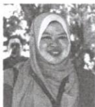
Rina Harun Menteri Pembangunan Luar Bandar