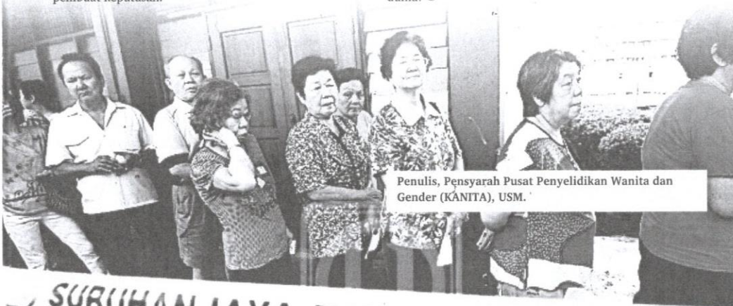
Penulis, Pensyarah Pusat Penyelidikan Wanita dan Gender (KANTITA), USM.

Buat masa sekarang, pemimpin wanita yang berada dalam barisan kepimpinan kerajaan baharu terpaksa menggalas tanggungjawab untuk membuktikan bahawa tangan yang mengayun buaian mampu menggongcang dunia!