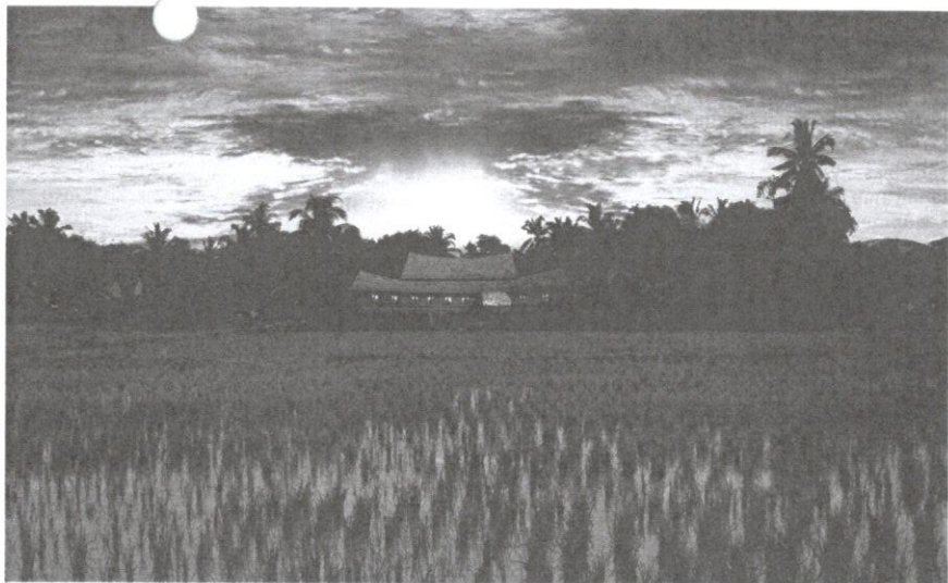
Pemilikan harta tanah merupakan hak milik suku, dan bukannya individu.