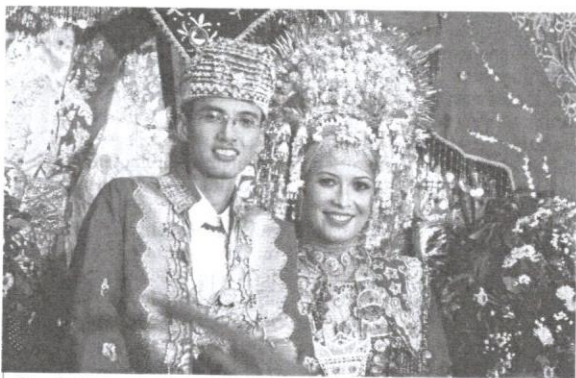
Selepas berkahwin, wanita Adat Perpatih tidak tinggal bersama-sama dengan keluarga, kecuali anak perempuan bongsu.

"Orang semenda disuruh pergi. Dia panggil datang; Raja orang semenda, tempat semenda."