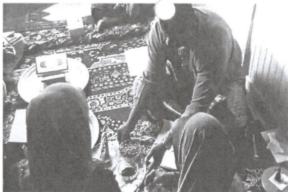
Proses kedim yang dilakukan dalam pengambilan anak angkat.

Amalan sistem adat ini ialah suami tinggal di rumah atau kawasan keluarga isteri selepas berkahwin. Pada masa yang sama, anak lelaki Negeri Sembilan pula meninggalkan rumah keluarga atau kampungnya dan berpindah ke rumah atau tempat keluarga isterinya pula. Hal ini memungkinkan wanita Adat Perpatih tinggal bersama-sama dalam satu kelompok masyarakat dan berada lebih selamat. Wanita Adat Perpatih tidak tinggal bersama-sama keluarga selepas berkahwin, kecuali anak perempuan bongsu. Apa-apa yang berlaku ialah sebaik-baik sahaja anak perempuan berkahwin, mereka akan membina rumah di atas tanah pusaka adat milik ibu mereka dan tinggal berdekatan dengan rumah ibu bapa dan saudara mara perempuan mereka. Hubungan kekeluargaan menjadi erat dan