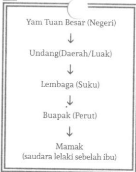
Rajah 1 Susur galur pemerintahan dalam Adat Perpatih.

Sistem unilateral-matrilineal ini merupakan dasar Adat Perpatih. Suku ialah gabungan daripada beberapa Perut yang masing-masing berkongsi nenek moyang. Walaupun sistem Adat Perpatih berasaskan Perut sebelah ibu, namun dari sudut pemerintahan dan pentadbiran adat, saudara lelaki sebelah ibu ialah ketua keluarga yang disebut sebagai mamak.