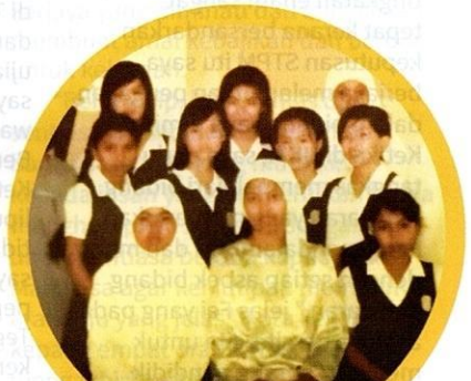
Fei bersama dengan rakan sekelas ketika di SK Salak South.

Menyedari akan hasrat ayah dan ibunya itu, Fei mula menunjukkan minat yang amat jitu dalam mata pelajaran Bahasa Malaysia dengan menyertai pelbagai aktiviti anjuran sekolah seperti membaca puisi, mengadakan persembahan pentas dan menyertai program berbalas pantun.