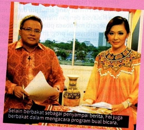
Selain berbakat sebagai penyampai berita, Fei juga berbakat dalam mengacara program bual bicara.