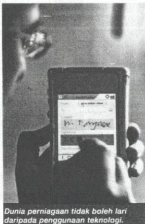
Dunia perniagaan tidak boleh lari daripada penggunaan teknologi.

Faedah e-niaga sangat besar kepada masyarakat pengguna Malaysia. Urusan niaga menjadi lancar dan boleh dilakukan dengan lebih mudah pada bila-bila masa atau di mana-mana