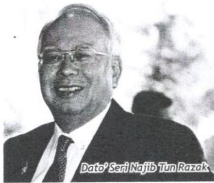
Dato' Seri Najib Tun Razak

Secara tuntas, populariti laman sosial itu terus berkembang pesat sehingga menjadi sebahagian daripada denyut nadi kehidupan masyarakat celik teknologi maklumat apabila setiap saat ada pengguna baharu mendafat. Oleh itu, diharap semua pengguna laman sosial berkenaan dapat memanfaatkannya secara berhemah dan bijak.