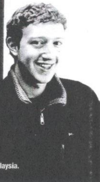
Facebook yang diasaskan oleh Mark Zuckerberg pada tahun 2004 merupakan laman sosial paling popular bagi rakyat Malaysia.