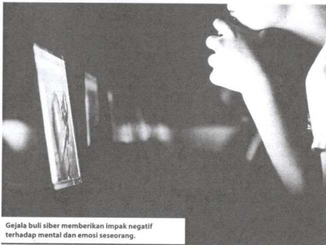
Gejala buli siber memberikan impak negatif terhadap mental dan emosi seseorang.

Kesedaran semua pihak amat penting untuk memastikan para pengguna di media sosial, terutamanya dalam kalangan pelajar dan remaja berada dalam persekitaran yang selamat. Tanpa usaha yang berterusan, pengabaian terhadap ancaman ini seakan-akan mempertaruhkan soal keselamatan, kesihatan dan kebajikan mereka pada masa akan datang dalam situasi yang berisiko.