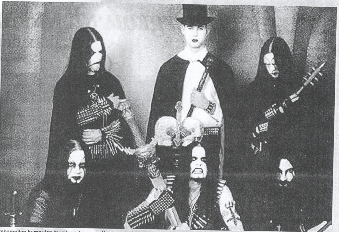
Penampilan kumpulan muzik underground bertentangan dengan nilai ketimuran.

loid di negara ini pernah melaporkan bahawa sesetengah remaja punk suka melakukan hubungan seks bebas dan meminum arak. Laporan itu juga menyebutkan bahawa remaja-remaja ini terpengaruh dengan budaya punk luar negara.