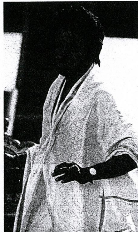
RAJINIKANTH, menjadi idola kaum lelaki.

Satu lagi kesalahan yang melibatkan remaja adalah lari atau hilang dari rumah. Pada tahun 1990, terdapat 1,578 kes, 1991 (1,981 kes), 1992 (2,221 kes) dan 1993 (1,485 kes).