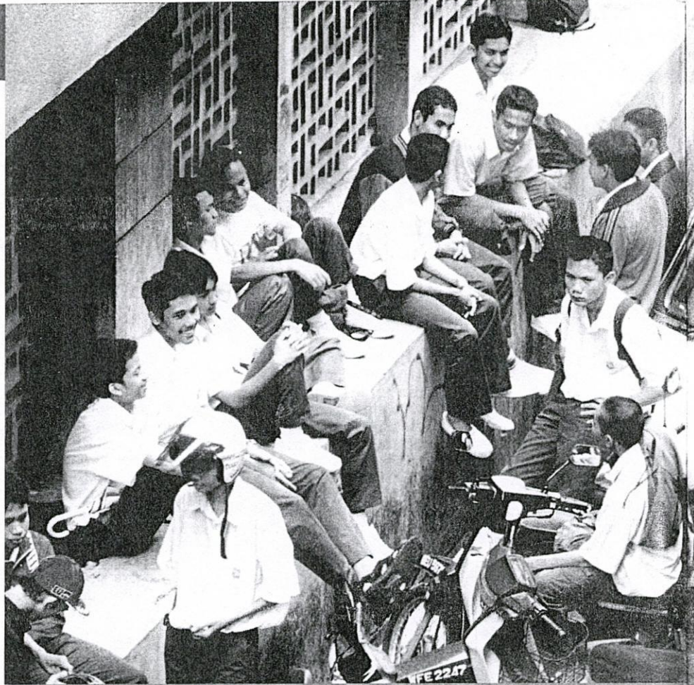
Pelajar perlu didekati golongan dewasa bagi mengelak mereka terjebak dengan emosi negatif. - Gambar hiasan