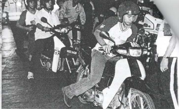
Ada remaja diperalatkan oleh pihak tertentu sehingga tanpa disedari terjebak dalam kegiatan jenayah.