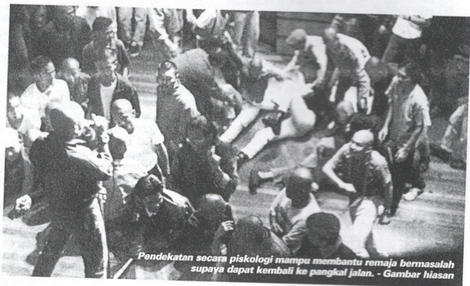
Pendekatan secara psikologi mampu membantu remaja bermasalah supaya dapat kembali ke pangkal jalan. - Gambar hiasan

Pelbagai andaian dikemukakan ekoran meningkatnya jenayah di kalangan remaja Malaysia kebelakangan ini. Mampukah langkah segera pihak berkaitan menangani fenomena serius itu daripada terus berlarutan?