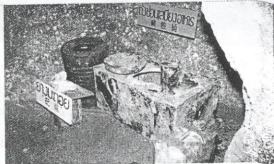
Gambar kem dan terowong gerila komunis di selatan Thailand.

Malaysia tidak boleh mengambil sikap yang sama. Kali ini terhadap Chin Peng, katanya.