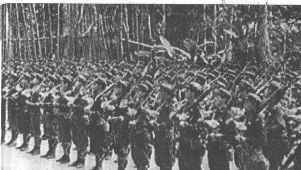
Barisan gerila komunis ketika zaman kemuncak pemberontakan mereka.

menderita angkara gerakan komunis suatu ketika dahulu.